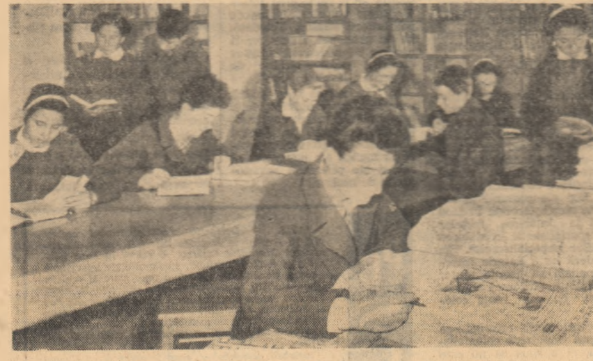
Aspect cotidian din biblioteca Școlii medii din Tirgu-Ocnă

În continuare au discutat, la rândul lor, delegații din Cipru, Maroc, Senegal și Franța. Lucrările conferinței continuă. (Agerpres)