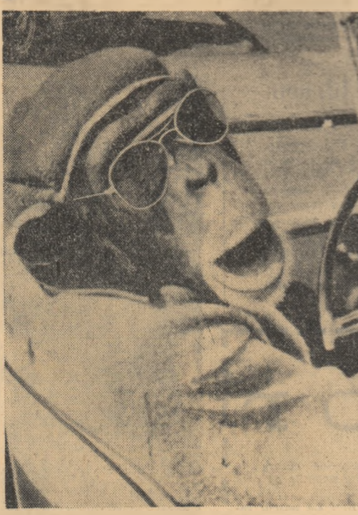
Agencia de circulație din statul Atlanta (S.U.A.) au rămas uimiți la apariția unui automobil condus de cimpanzeu „Chappy”, a cărui figură parcă spune: lăsați circulația pe șosele noastre... și, nu vor mai fi altfel accidente. Dar drorul lui, prudent, avea la dispoziție o a doua comandă. Totuși, „Chappy” a parcurs distanța mai singur. (Infotografie: cimpanzeu „Chappy” la volanul mașinii cu care și-a făcut plimbarea.