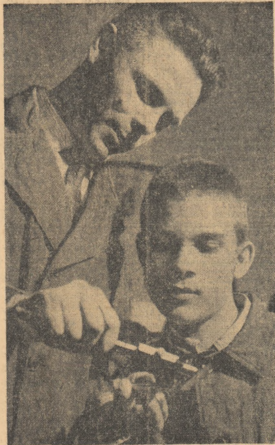
„Maistrul și ucenicul” O imagine colidantă din atelierul de lăcătușerie al Grupului școlar petrol-chimie — Ploiești

dat peste plan 6 000 tone de oțel țagă și laminate ușoare. De asemenea, productivitatea muncii a crescut cu aproape 7 la sută față de sarcina planificată. Succese asemănătoare în îmbunătățirea calității produselor și creșterea producției și productivității muncii au înregistrat și colectivele uzinelor „Unirea”, „Carbochim”, „16 Februarie” și „Tehnofrig”, ale Atelierele de reparat material rulant și altele. (Agerpres)