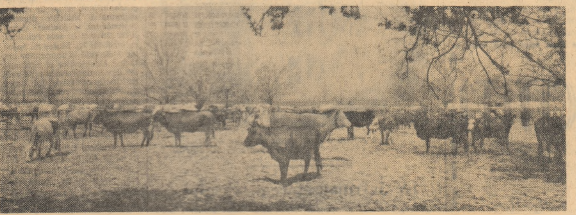
Situată în imediata apropiere a Capitalei, G.A.C. Otopeni are, pe lângă cultura plantelor cerealiere și legumicultură, un puț laț, vacile gospodăriei în stabula liberă de lângă grajduri