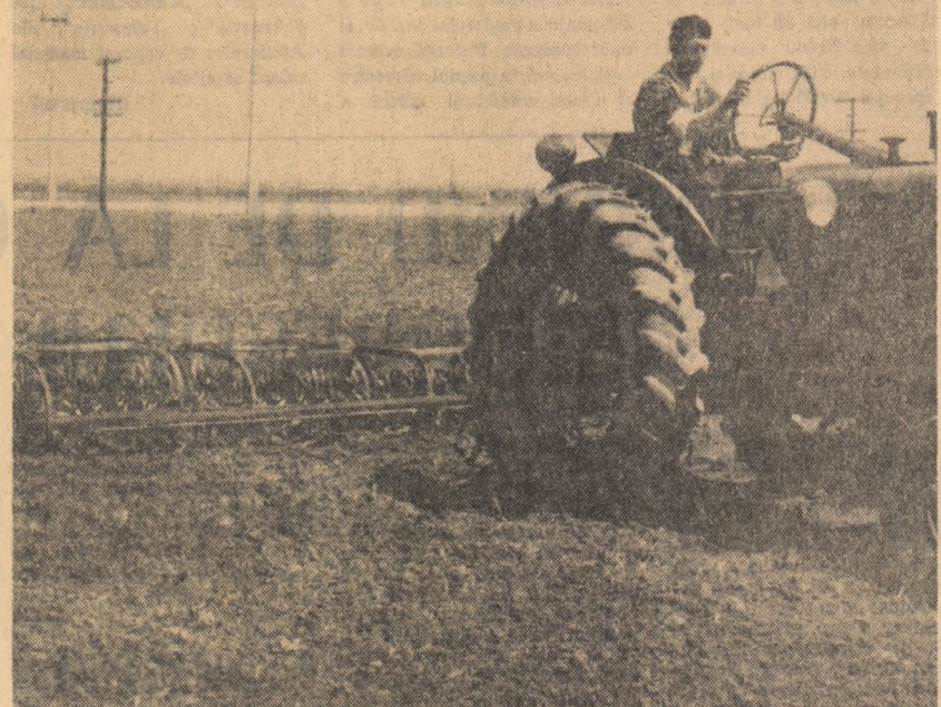
Mecanizatorii care lucrează pe ogarele G.A.C. Fărcașele, raionul Caracal, execută în aceste zile lucrări de întreținere a culturilor cu ajutorul sapei rotative

Gospodăria colectivă din Ciurapi, raionul Fetești, se situează printre primele gospodării care au început lucrările de întreținere a culturilor cu ajutorul sapei rotative