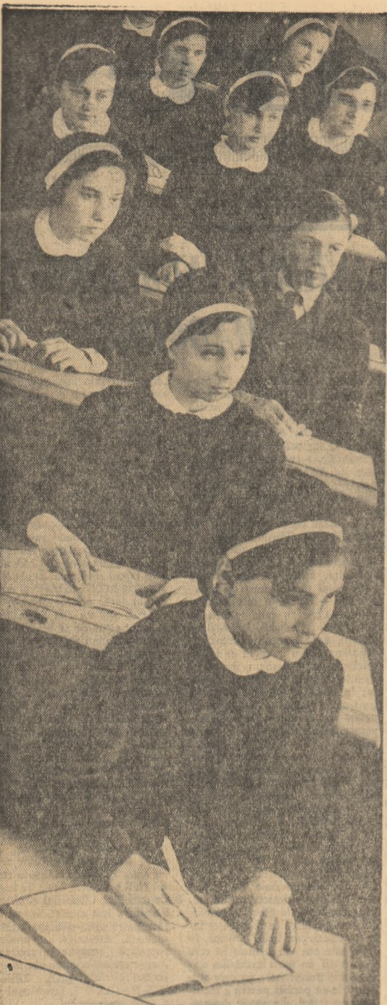
La fiecare lecție — atenție și concentrare

Nu voi neglija nici celelalte obiecte, pentru care am repartizat în programul meu zilnic timp corespunzător.