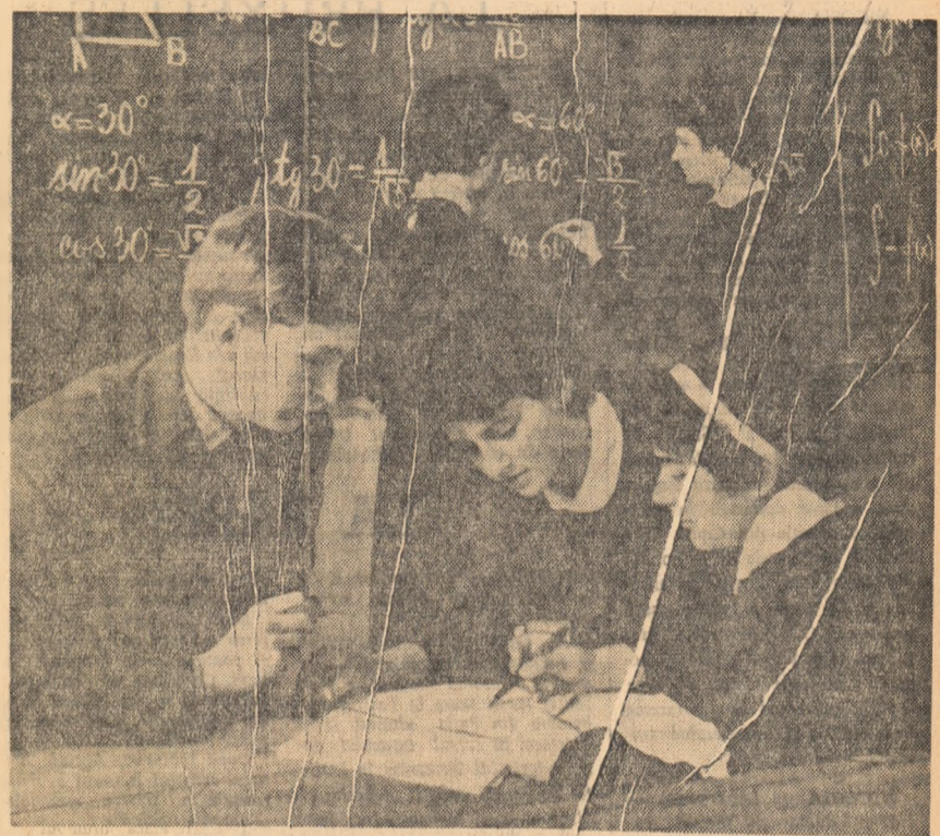
Imagine obișnuită în Școala medie nr. 2. Elevii claselor a XI-a se pregătesc cu sîrguință pentru maturitate.