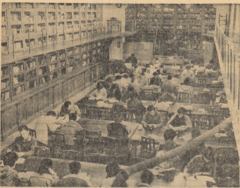
Atmosfera de presiune într-una din bibliotecile Universității din București