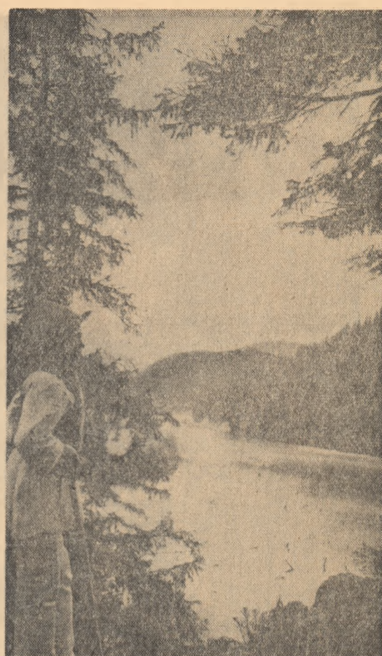
Imagine de la Lacul Roșu