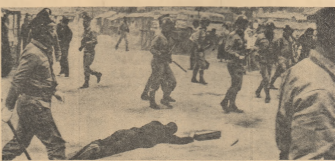
Recent la Seul au avut loc noi demonstrații studentești antiguvernamentale, pe care dețesmentele de represivie le-au împrăștiat cu brutalitate

Au fost vizitate apoi casele, galeriile, muzeele, biserica și fundația clădirii hidrocentralei.