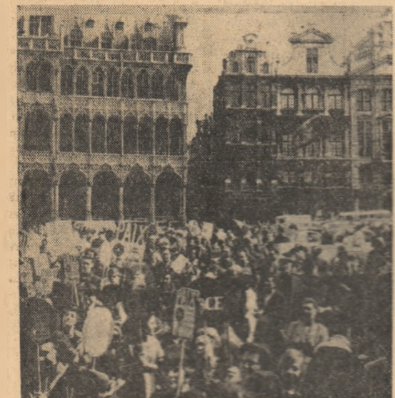
BELGIA: Aspect de la o demonstrație pentru pace ce a avut loc recent la Bruxelles