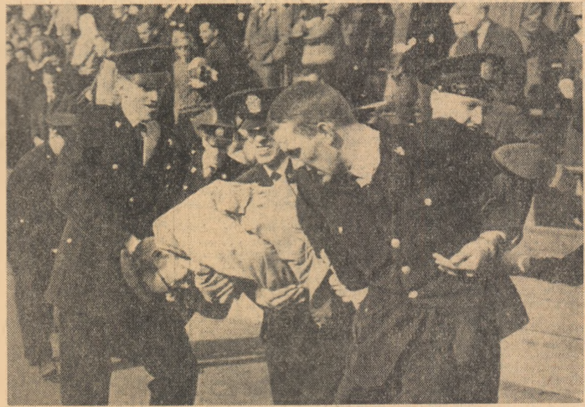
Recent, la Oslo, numeroși tineri condamnă politica rasistă a O.N.U. din Congo, au împiedicat înfierea unui meci de tenis dintre Norvegia și Republica Sud-Africană. În fotografie: Poliștii încearcă să împiedice pe demonstrații

LEOPOLDVILLE 18 (Agerpres). — Operațiunile de retragere a trupelor O.N.U. din Congo se apropie de sfârșit. De la 20.000 de militari ai O.N.U. cîți se aflau în această țară în ianuarie 1963, numărul acestora s-a redus în prezent la mai puțin de 3.000. Data retragerii definitive a forței O.N.U. a fost stabilită de secretarul general al Națiunilor Unite, U Thant, la 30 iunie 1964 cînd va avea loc a 4-a aniversare a independenței Republicii Congo. După cum transmite agenția Reuters, în operațiunile desfășurate în Congo, 130 ofițeri și soldați din forța O.N.U. au fost uciși, 140 au fost răniți și 50 au decedat în urma unor accidente. În local militarilor O.N.U. vor rămîne cei 30.000 de oameni ai armatei naționale congoleze, care este în prezent reorganizată și reechipată cu sprijinul S.U.A., Belgiei, Italiei și Israelului.