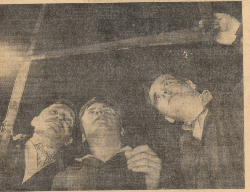
Membrii cercului roto al Casei de cultură din Caracal controlează cu interes rezultatele activității lor.

● Un nou record mondial de haltere a fost stabilit în cadrul