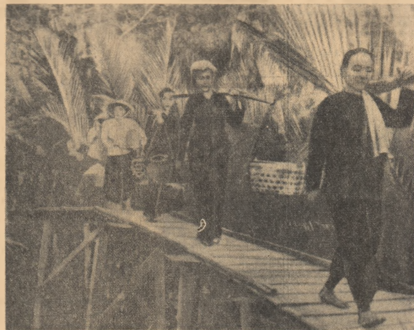
Populația sud-vietnameză acordă sprijin partizanilor care luptă împotriva regimului dictatorial de la Saigon, pentru eliberarea deplină a țării, pentru independența națională.