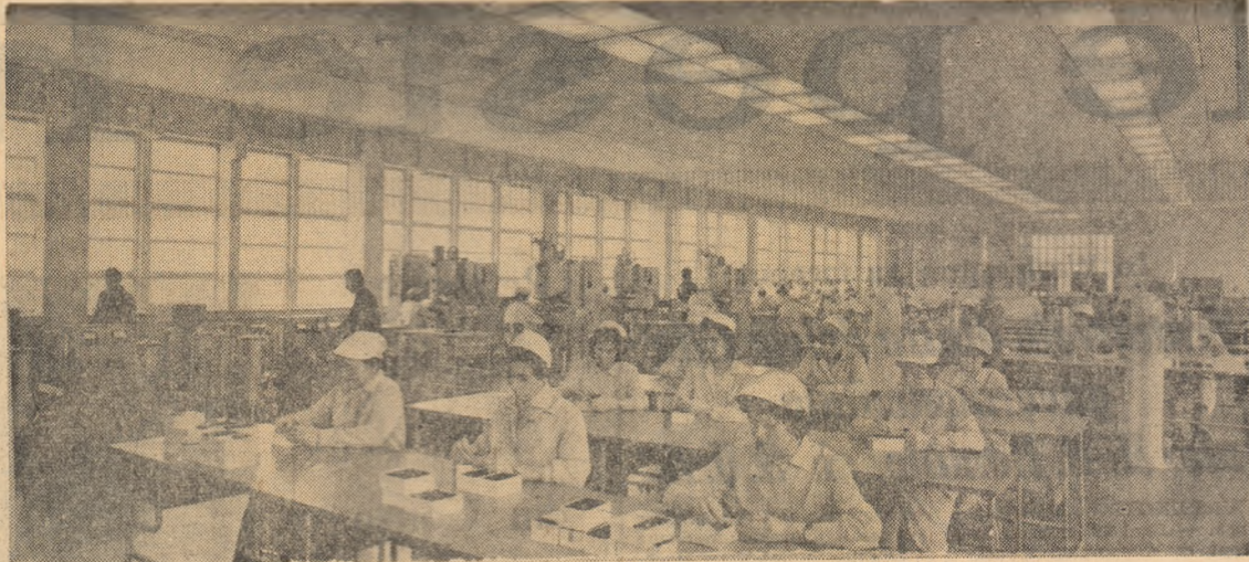
Linia de asamblare a tranzistorilor de la Fabrica de piese de radio și semiconductori din Capitală