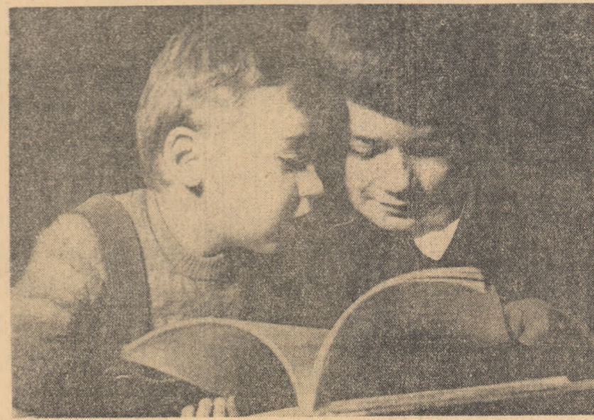
— „Vreau să știu și eu”