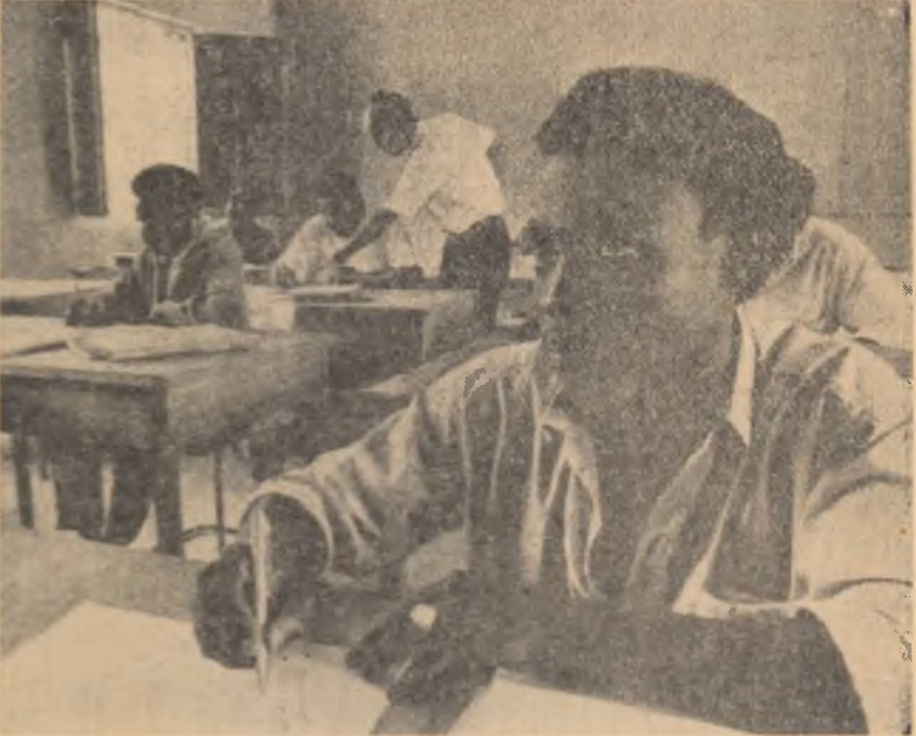
Africa își lecuiește rănila lăsată de colonialism. Pentru mulți africani, de abia acum s-au deschis porțile școlilor

Lucrările conferinței s-au desfășurat într-o atmosferă constructivă, animată de dorința de uniune și înțelegere reciprocă a tuturor participanților.