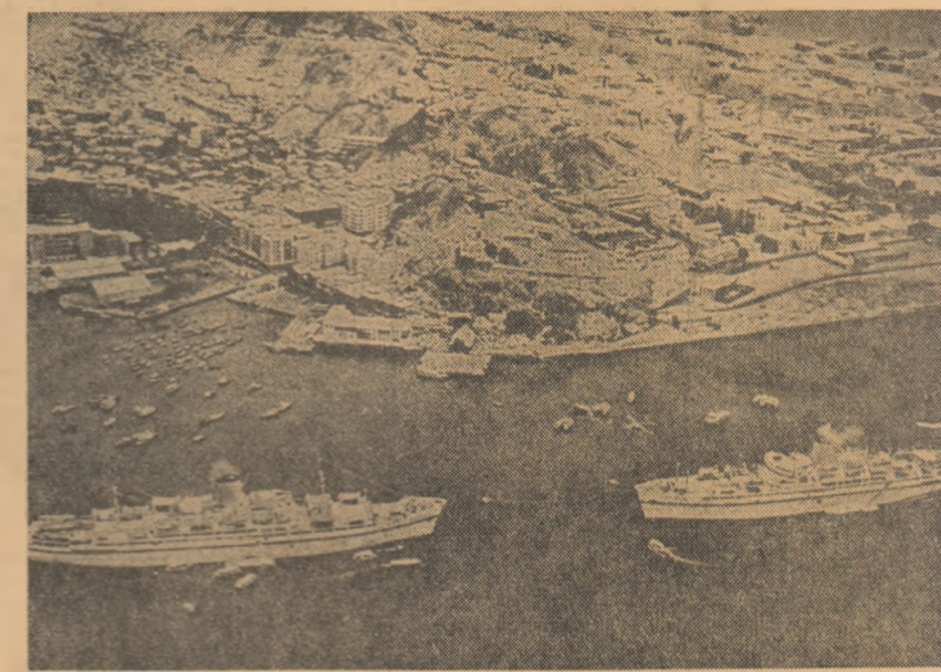
Imagine a portului Aden

În cadrul Conferinței de presă s-a acordat, de asemenea, faptul că în cazul tratatelor noi s-au pus condiții politice și că s-au înregistrat noi și importanți pași în direcția unei dezvoltări progresive a relațiilor romino-americane în avantajul reciproc al celor două țări.