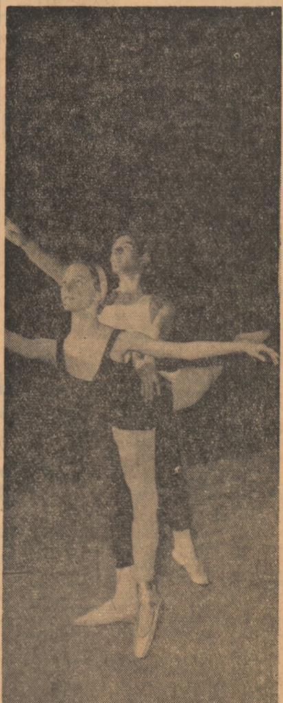
Armonie (elevi din anul VII al Școlii de coregrafie din București)

200 kg pe mp. Aceasta permite reducerea termenului de execuție la obiectivele industriale care necesită o construcție rapidă. Din același tip a fost realizat cimentul Rim-300 care va fi folosit la fabricarea tuburilor de ciment centrifugate.