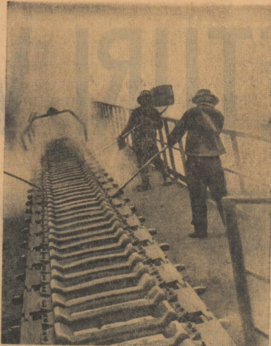
Din jurnal fonta ajunge pe banda de turnare în flux