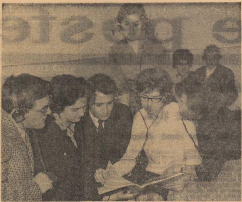
Studenții ai Conservatorului „Ciprian Porumbescu” ascultând la câști, un concert simfonic.