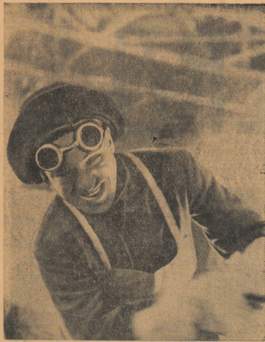
Fonta a izbucnit din jurnal. Pe chipurile oamenilor — bucuria luptei cu iocul