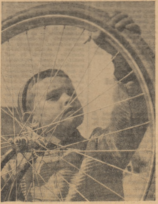
Indeletnicire de sezon.