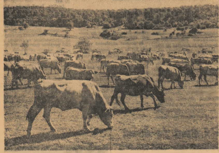
Pe pășunea bine îngrijită, ierburile valoroase asigură hrană consistentă