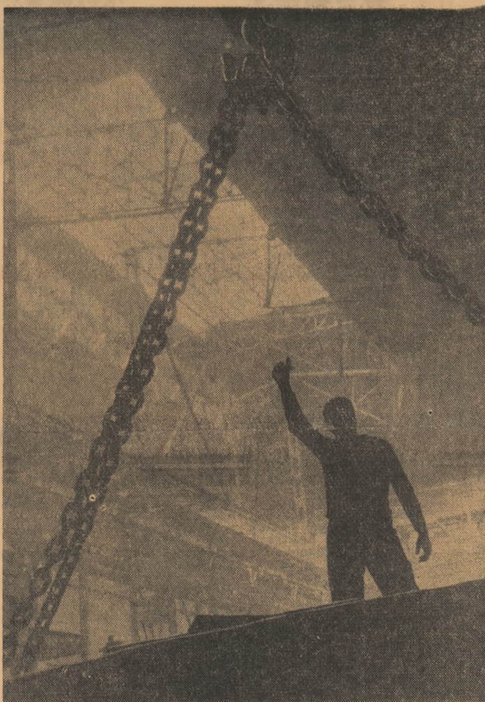
În hala uneia din cele două turnătorii