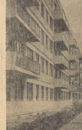
Pe strada Galați, din orașul Braila