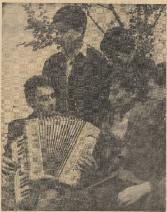
În orele libere, cu cîntecul, prietenul nostru comun (un grup de elevi ai Școlii profesionale de ucenici de pe lângă Fabrica de rulumenți din Birlăd)