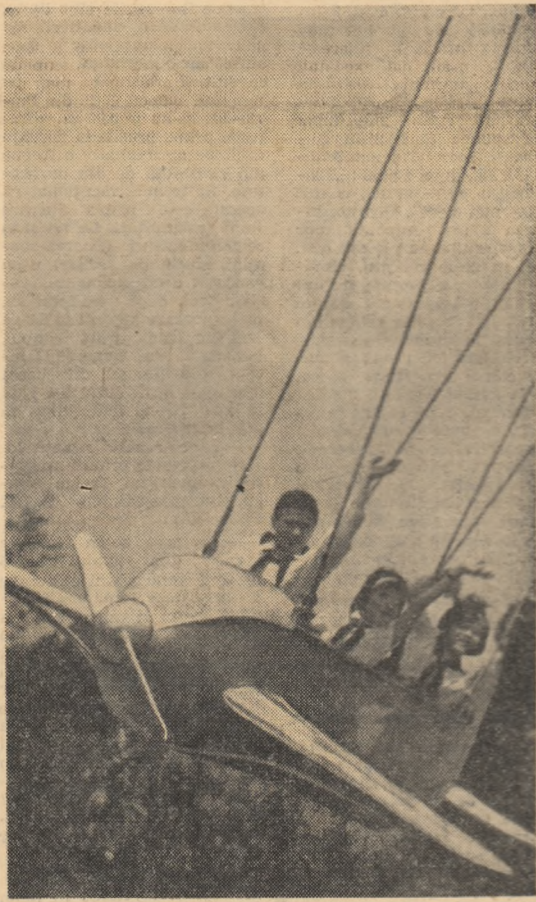
Pe aripile... vacanței