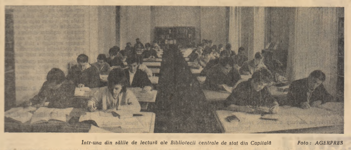
Într-una din sălile de lectură ale Bibliotecii centrale de stat din Capitală