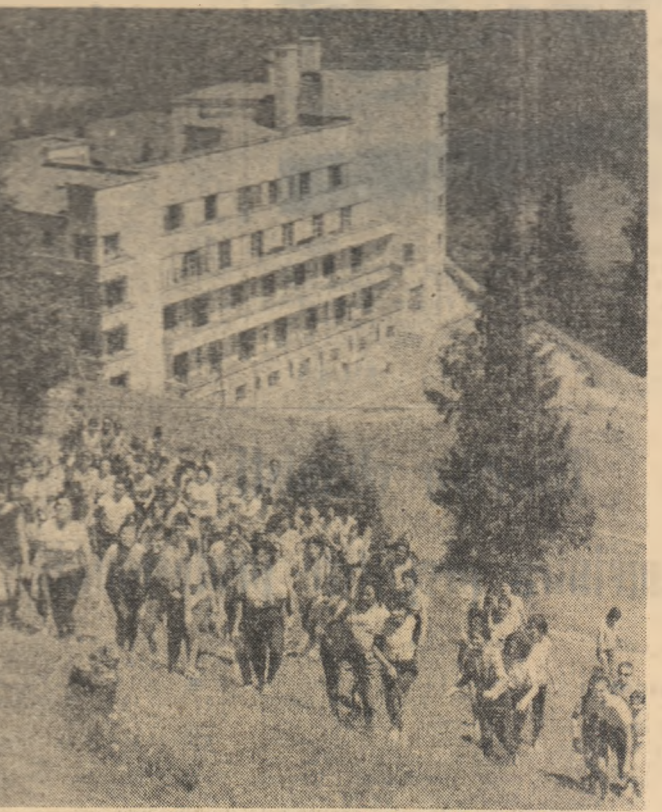
În excursie la Cota 1400...

La aniversarea acestui, lunar, noi participă peste 15.000 de oameni și muncitori din regiunea Ploiești. Timpul din vremea seară a acestor excursii se și găsește în cadrul zilei de azi pe Valea Prutului și Valea Sîmbului. Peste 20 de formații artistice de amatori prezintă în aceste zile spectacole de mare interes și bogate programe artistice, în repertoriul cărora sînt cuprinse cântecuri patriotice și populare din țară, programe de brigadă artistică, scurte piese de teatru în cite un act.