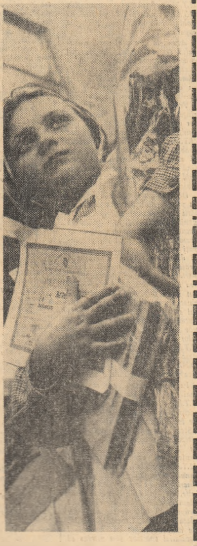
Asaui, au început serbările de sfîrșit de an, intrate în tradiția noastră școlară. Ele confirmă că și cei mai mici școlari — elevii claselor I-IV — au mai crescut cu un an. Cu ajutorul plin de grije al tovarășilor învățători, au mai adăugat, cu sîrguință, noi cunoștințe la zestrea pe care și-o pregătiseră pentru viață, zestre de care vor avea nevoie cînd vor fi mari. Decamdată, această zestre este frumos arîndată în cartelele de elevi, în care astăzi, după 8 luni de școală, s-au aliniat note bune și foarte bune, spre bucuria școlii, a părinților și, firește, a școlărilor. Cîntecul „Dănsul toată lumea”, cântecurile spuse cu sfîșiecia celor care apar pentru prima oară în fața publicului, bucuria, feliicitările, reoărsarea de flori dăruite învățătorilor, sînt fi-rești în asemenea ocazii. Așa se sărbătoresc succesele la învățătură. Să le urăm pentru viitorul an școlar succese și mai mari. În fotografie, un aspect de la serbarea de sfîrșit de an a elevilor din clasele I-IV de la Școala medie nr. 24, din Capitală.