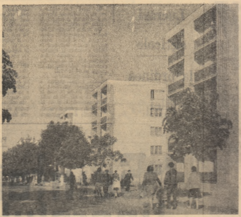
Construcția pal. T. Severin