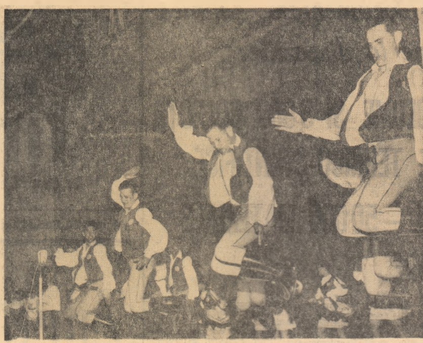
Formația de dansuri a tinerilor din Miercurea Niraj, raionul Tg. Mures

rii generale. Traducerile multe și bune, așa cum le avem acum în țara noastră, sînt desigur pentru marea public cetăție de un nemăsurat folos. Studenților însă le-aș recomanda să cunoască neapărat cel puțin una sau două limbi străine de mare circulație. Dacă nu le cunosc sau nu le cunosc încă bine, să înceapă neapărat să le învețe sau să le cultive cît mai mult și mai adînc. Cunoașterea limbilor străine este un factor important al aceluia lărgiri de orizont care este, după cum am văzut, rezultatul esențial al culturii generale și ajută în chip deosebit adăugarea și cultivarea rodnică a specialității. Chiar în specialitatea pe care și-a ales-o, studentul va găsi în limbi străine un material care, încă netradus, îi va completa cunoștințele. Acest lucru nu este valabil numai cu privire la literatură și la poezie, deosebit Mergera directă la surș este întotdeauna preferabilă. Dar chiar în afara acestor rezultate practice directe, cunoașterea limbilor străine oferă aceeași atracție și același câmp pe care îl oferă călătoriile deosebite satisfăcătoare nevoia de nouă și stimulează curiozitatea fiind chiar numai prin asta o excelentă gimnastică a minții.