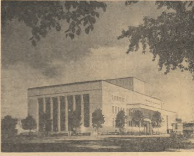
Recepție la ambasada R. P. Romine din Budapesta

Acest dezechilibru, scrie AGEFI, s-a soldat în primele trimestre ale anilor 1962 și 1964 pentru Germania occidentală cu un excedent al balanței în schimbului cu partenerii săi din Piața comună, în timp ce pentru Italia și Franța s-a soldat cu un deficit crescînd atîngînd în acest an 204 000 000 dolari și respectiv 62 000 000 dolari. Vicepreședintele organului executiv al Pieței comune și-a exprimat, totodată, regretul în legătură cu faptul că amenințarea persistentă a inflației în țările C.E.E. duce la înrăutățirea situației economice a Pieței comune ceea ce ar putea provoca o recesiune sau o stagnare. În incheiere, Marjolin a insistat din nou asupra limitării cheltuielilor publice, mergînd chiar pînă la reducerea investițiilor și la suspendarea subvențiilor pentru servicii publice care vor trebui să-și asigure propriul lor echilibru financiar. El a declarat că ar fi de dorit să nu se descurse revindicările privind creșterea salariilor.