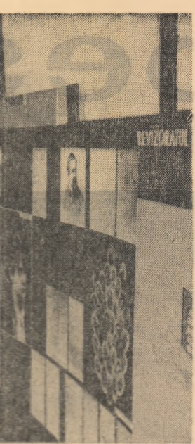
La expoziția comemorativă „Mihail Eminescu”