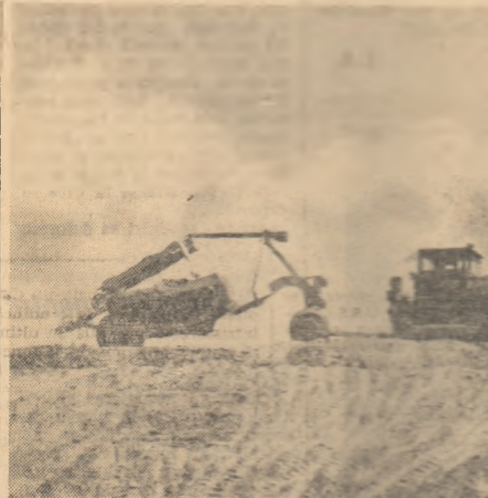
Pe șantierul de îndiguire Brateștii de Jos, regiunea Galați, utilaje grele lucrează la construirea unui dig de aproape 20 km care va săvîrși revărsarea Prutului pe o suprafață inundabilă de 13000 ha. Prin această lucrare au fost redat agricole culturile auzul în acest an 3000 de hectare de teren.