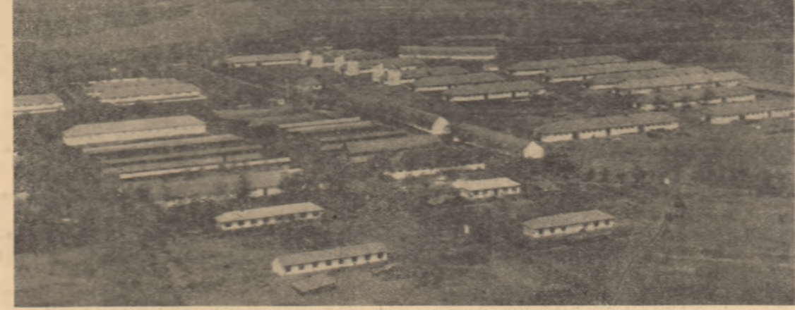
Imagine din avion; sectorul zootehnic al G.A.C. Biled, regiunea Banat

În mesaj se arată că guvernul R. P. Romîne este conștient de dorința fierbinte de pace, vor continua să militeze activ pentru menținerea unor relații de bună vecinătate și prietenie cu toate țările din Balcani.