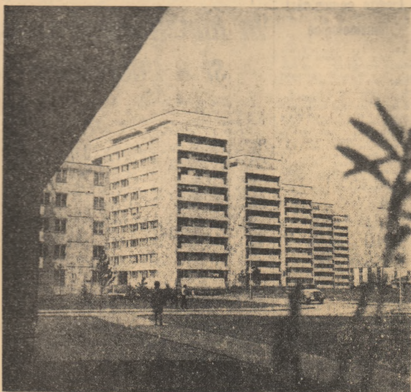
Noi construcții în cartierul Balta Albă din Capitală.