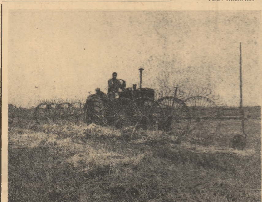
(Continuare în pag. a V-a)

ADJUNCT AL MINISTRULUI TRANSPORTURILOR ȘI TELECOMUNICAȚIILOR să împărtășească cititorilor noștri concluziile desprinse din materialele publicate, măsurile pe care ministerul le-a luat pentru a asigura o pregătire cit mai bună viitoarelor cadre de șoferi.