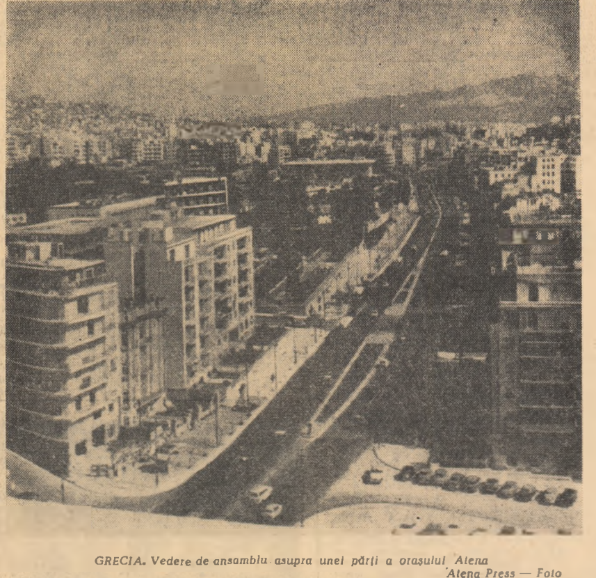
GRECIA. Vedere de ansamblu asupra unei părți a orașului Atena

Propunerile lui Stikker constă în acordarea unor împuterniciri mai mari secretarului general al N.A.T.O., astfel încît acesta să poată obține informații asupra tuturor secretelor militare ale blocului. El preconizează, de asemenea, participarea unui reprezentant al secretarului general la toate întrunirile grupului permanent și numirea unui consilier militar pe lîngă fiecare reprezentant al țărilor membre în consiliul N.A.T.O.