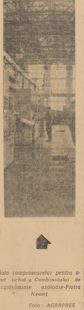
Sala compresoarelor pentru azot lichid a Combinatului de înghețăminte azotoase-Piatra Neamț