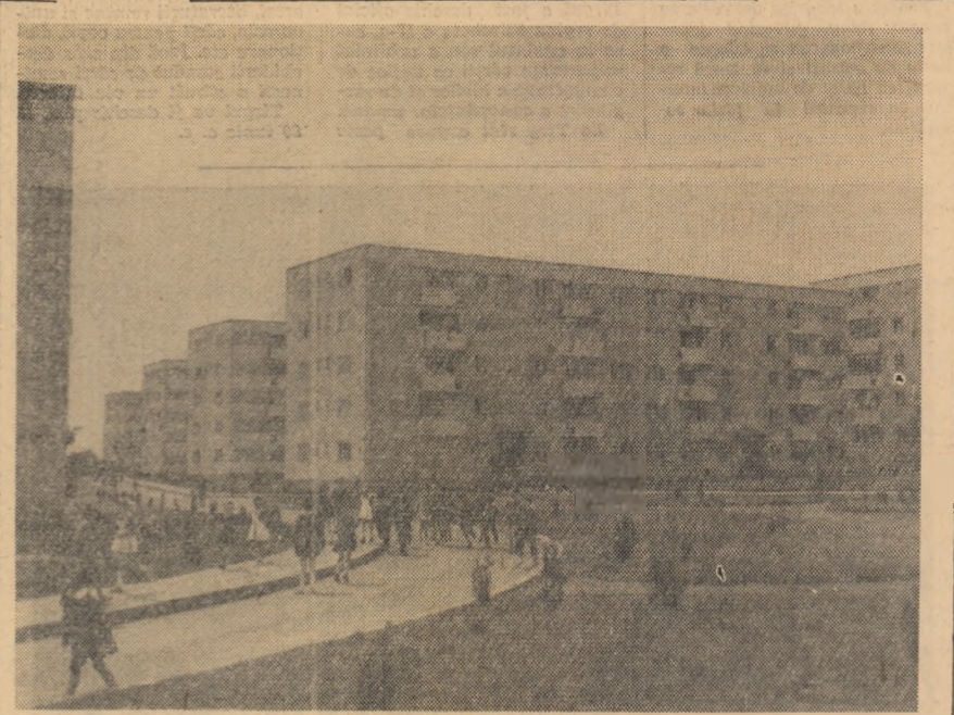
Noi construcții în orașul Tirgoviște