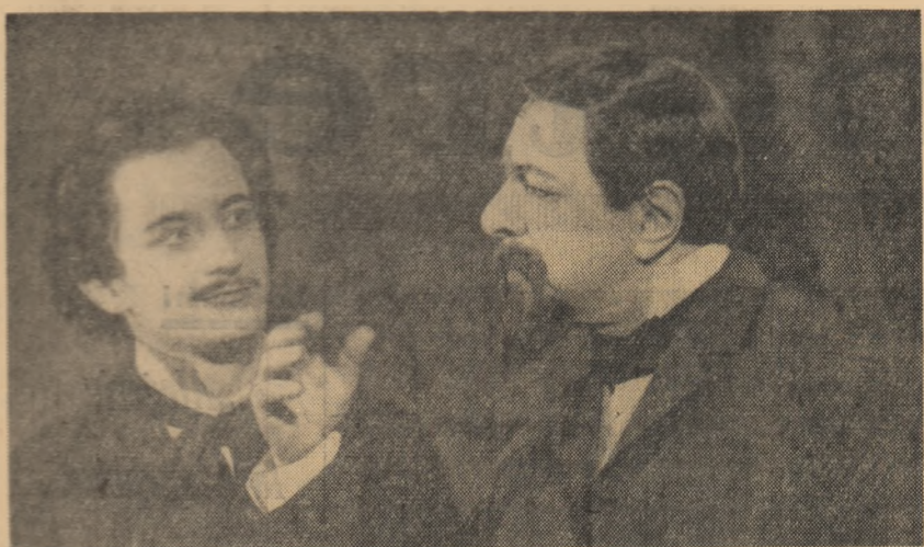
Scenă din spectacol