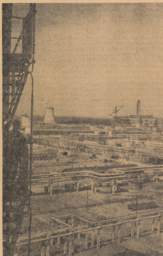
Vedere parțială a Râului Bistrița