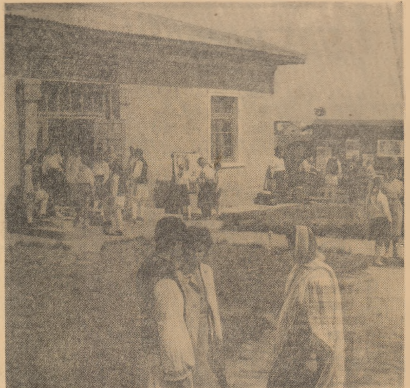
Un nou limb la căminul cultural (comuna Frumușani, regiunea București)

TUDOREL OANCEA correspondentul „Știntei tineretului” pentru regiunea Galați