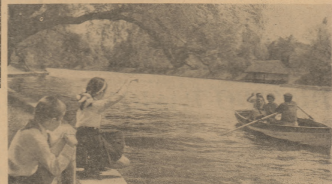
Zile de vacanță în parc

Concomitent cu efectuarea reparațiilor, S.M.T. au acordat o mare atenție pregătirii, în continuare, a mecanizatorilor. În perioada aceasta au fost școlarizați la centrele de instruire permanentă de la Călugăreni, Ciulința și Roșiori, un număr de 950 de mecanici de prese. La Urziceni au fost, de asemenea, instruiți timp de 7 zile toți șefii de brigăzi în vederea folosirii utilajelor la întreaga lor capacitate. Aceste instruirii s-au făcut fără a