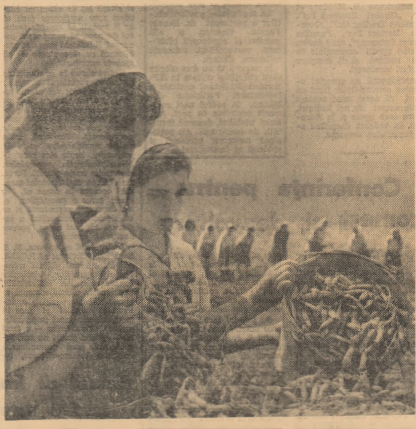
Recitarea mazărei la G.A.C. Dărești, regiunea București