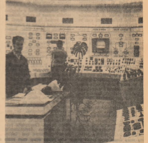
Sute de aparate, manete și butoane, flori și plășe exotice. Acesta este interiorul camerei de comandă de la Termocentrala Ludus-Ierul, în care doi oameni urmăresc și dirijează funcționarea cazanelor, turbinei și generatorilor.