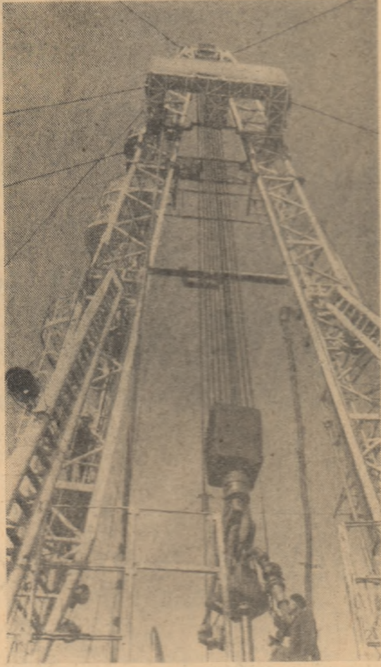
De aici începe drumul țiteiului