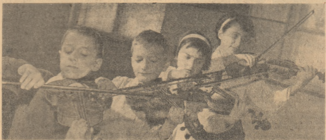
Un viitor „cvarțel” de reputați instrumentiști