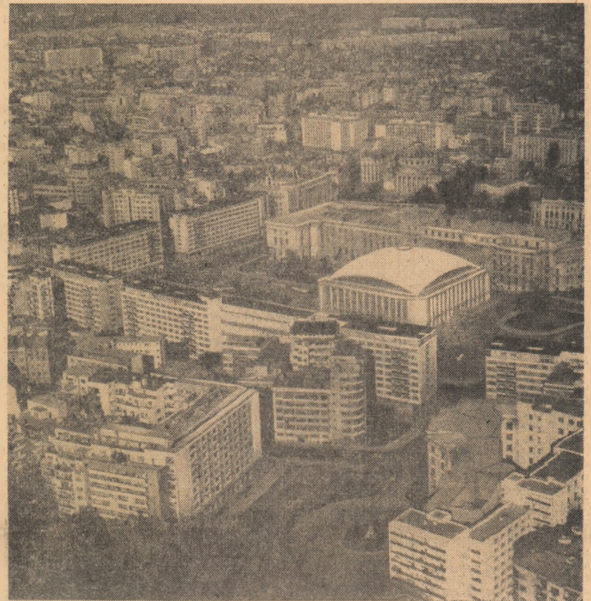
Piața Palatului (vedere din avion)