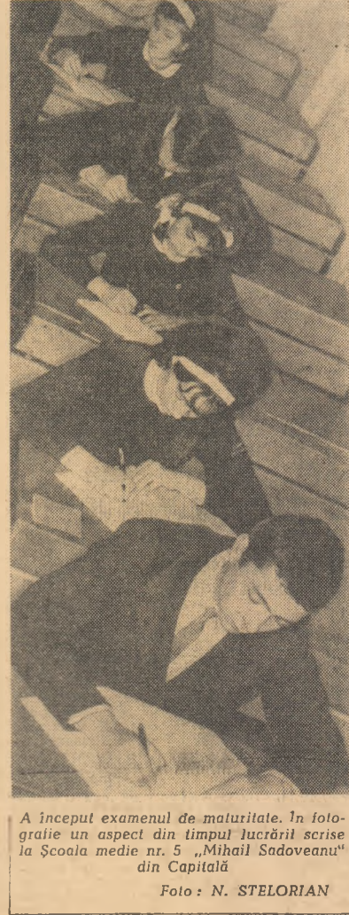
A început examenul de maturitate. În fotografie un aspect din timpul lucrării scrise la Școala medie nr. 5 „Mihail Sadoveanu” din Capitală