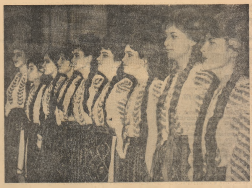
Grupul vocal al Casei de tineret din raionul Grivița Roșie

In cursul zilei de vineri și sîmbătă, așteptînd vizitarea manifestărilor consacrate comemorării a 75 de ani de la moartea lui Mihail Eminescu, au vizitat orașul Suceava și mîntăușii Voroneț și Sucevița.