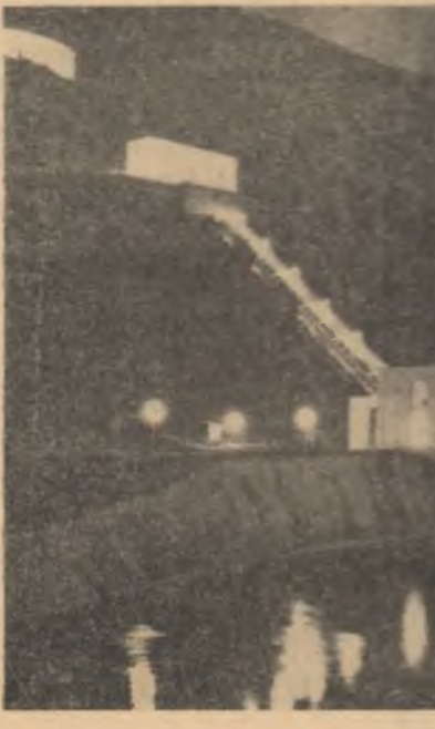
Nocturnă la Stejaru

În gospodăriile agricole colective din regiunea București continuă intens lucrările de întreținere a culturilor și pregătirile pentru recoltările de vară. La porumb prașila a treia a fost efectuată pe mai mult de o treime din suprafața cultivată. În unele unități această lucrare se apropie de sfîrșit, întreținerea este avansată și la celelalte culturi. La sfecla de zahăr prașila a treia a fost terminată, iar la floarea-soarelui a fost executată în proporție de 75 la sută. La aceste culturi a început prașila a patra. Datorită ritmului susținut în care se desfășoară lucrările de întreținere a culturilor, în regiune există condiții ca pînă la începerea recoltărilor de vară să se termine prașila a treia la porumb și la floarea-soarelui și cea de a patra la sfecla de zahăr.