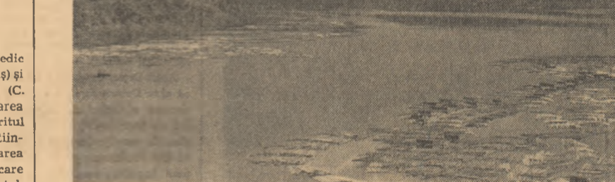
Lacul de acumulare Bicaz. Căldătoria plutelor se incheie aici, la patele Ceahlăului