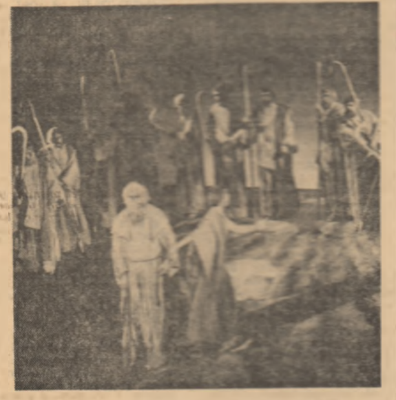
Scenă din piesa „Oedip la Colonos” — scena prezentată de Teatrul „C. I. Nottara”