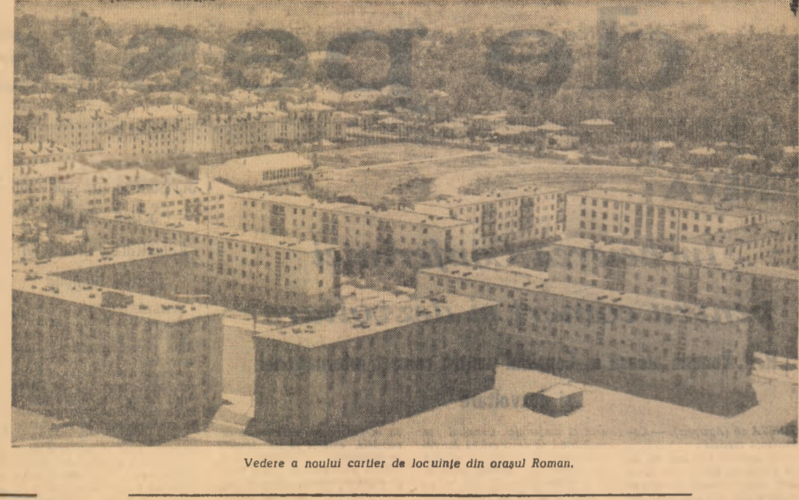
Vedere a noului cartier de locuințe din orașul Roman.