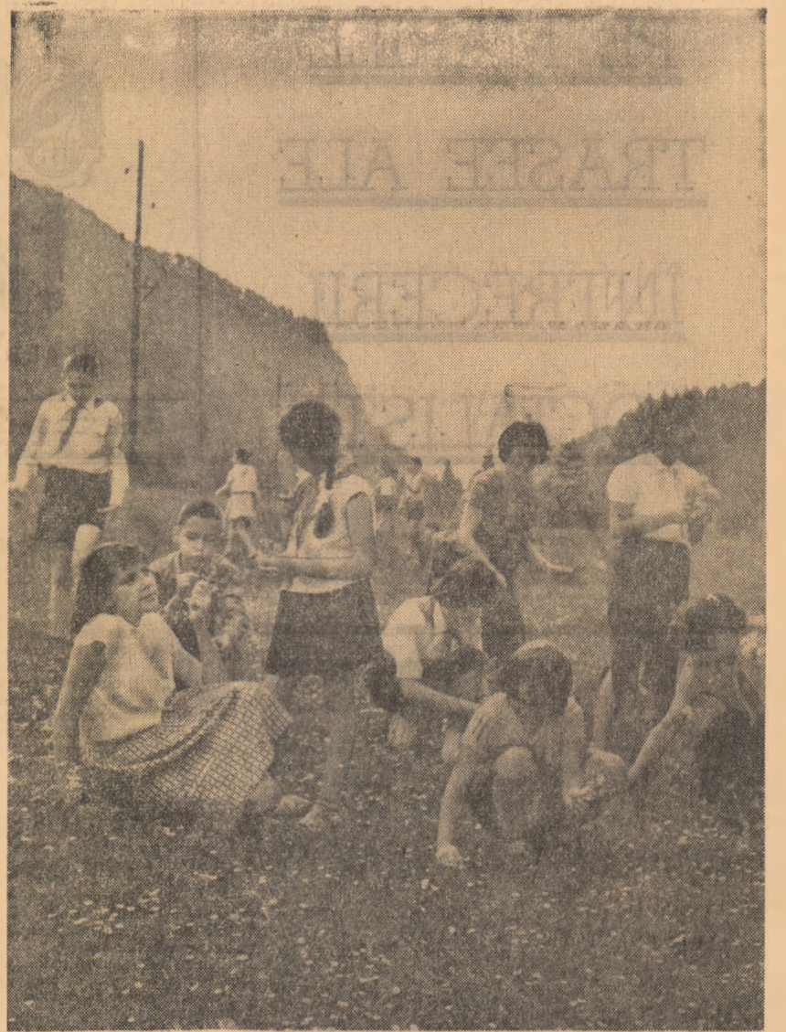
Introducerea la vacanță: excursie pe Valea Prahovei