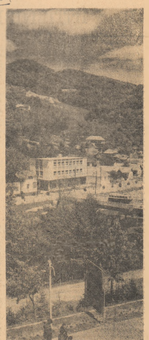
Vedere din stațiunea balneo-climaterică Olănești