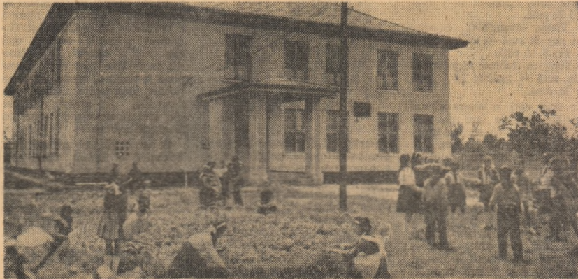
Două din zecile de școli noi care s-au construit și se construiesc pentru elevii patriei: Școala de 8 ani din comuna Cornetu (București) și Școala medie din Bala de Arieș (regiunea Cluj)