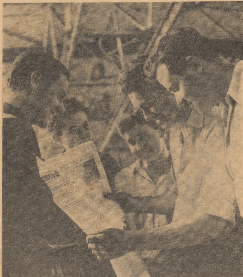
Ca prelușcând în țară și la Uzina de pompe din Capitală recenta Hotărâre a Comitetului Central și Partidului Muncitoresc Român și a Consiliului de Miniștri al Republicii Populare Române, este primită cu viață și cu simțire.