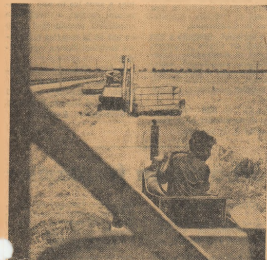
Recoltatul orzului este în regiunea București lucrare la ordinea zilei. În fotografia alăturată îi vedem la lucru pe mecanizatorii din gospodăria agricolă de stat Buftea care recoltează această cultură de pe ultimele suprafețe

Plenara Comitetului Central al Uniunii Tineretului Muncitor