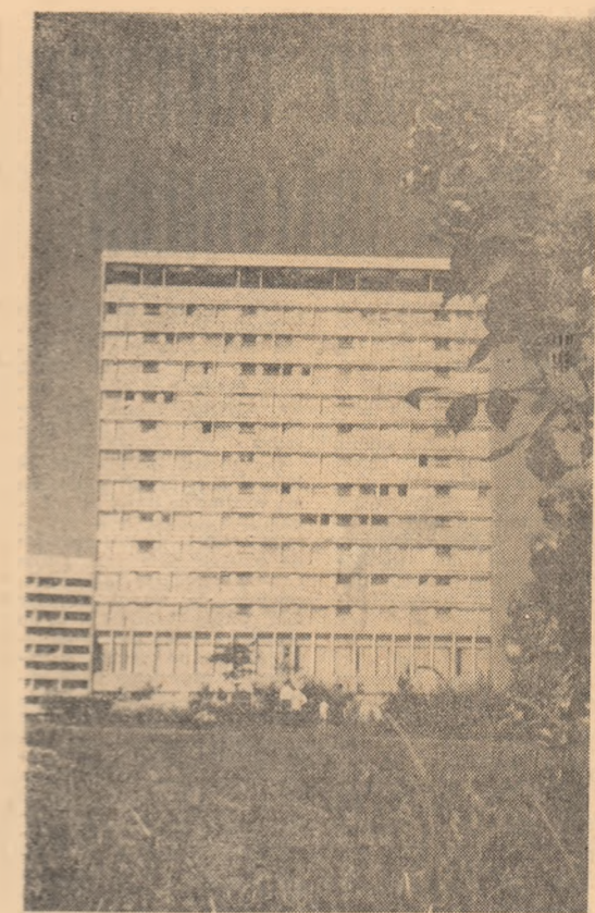
Construcții noi la Constanța