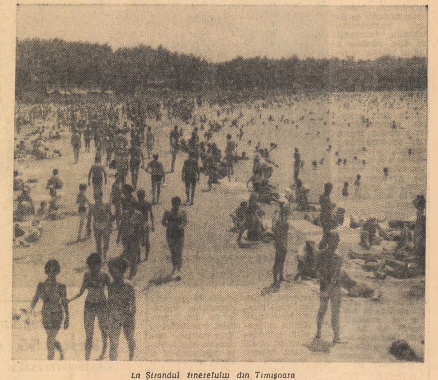
La Strandul Ineretului din Timișoara.