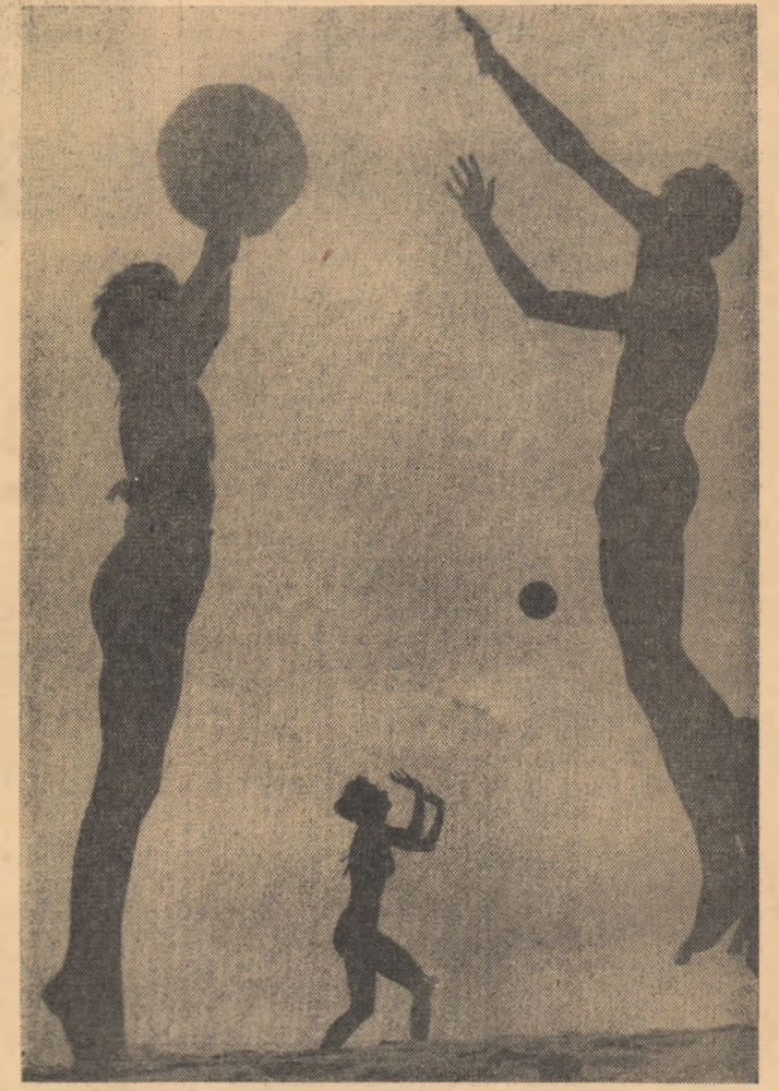
Tinerețe... (În tabăra studențească de la Costinești)

ION GHEORGHE MAURER Președintele Consiliului de Miniștri al Republicii Populare Române