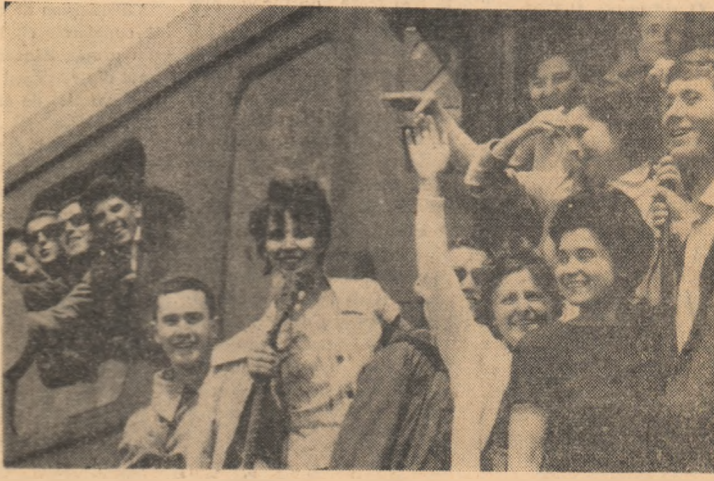
„Bine te-am găsit tabără!” (O nouă serie de elevi sosește la Năvodari)

Peste 75 la sută din numărul de muncitori și maștri care lucrează pe șantierele lucrărilor pe rețele de construcții ale țării au fost pregătiți în ultimii zece ani.