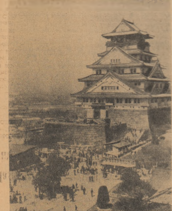
În Japonia, castelul Ogaka (sec. XVI) este considerat ca unul din cele mai frumoase monumente istorice. În fotografie: castelul Ogaka

În cadrul primei ședințe a fost primit în O.U.A. noul stat independent Malawi. A fost ales apoi președintele conferinței — ministrul de externe al R.A.U., Mahmud Riad, care a rostit un discurs. Vicepreședinți ai conferinței au fost aleși miniștrii de externe ai Coastei de Fildeş și statului Malawi. Lucrările au fost redate apoi în cadrul ședințelor secrete.