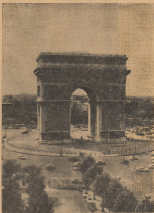
14 iulie este ziua națională a Franței. Poporul francez aniversază astăzi momentele istorice ale anului 1789, când Bastilia, intrucupare a despotismului monarhic, a fost cucerită și distrusă de către revoluționarii. 14 iulie este sărbătorit în toată țara prin mari sărbători populare.