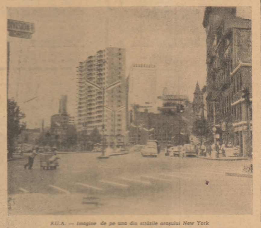
S.U.A. — Imagine de pe una din străzile orașului New York

Înainte de a se reîntoarce la Nicosia, el a vizitat comunitatea cipriotilor turci din Lapithos, nu departe de Paphos, unde a fost întâmpinat atât de populația greacă cât și de cea turcă. Comunitatea turcă din această localitate, care numără 170 de persoane, și-a abandonat locuințele la începutul ostilităților dintre cele două comunități. După ce au primit asigurări că nu vor avea nimic de suferit, locuitorii ciprioti turci s-au reîntors la locuințele lor, unde și-au regăsit bunurile și casele intacte.