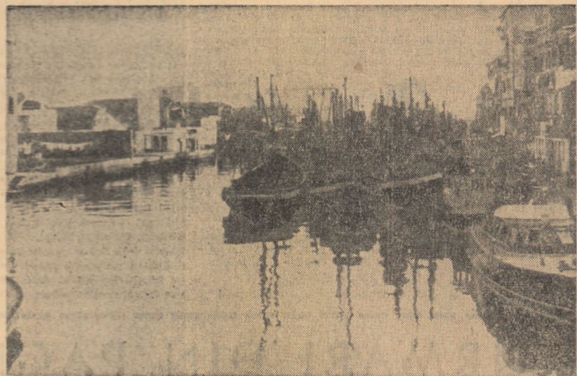
ITALIA: Cunoscut peisaj venețian