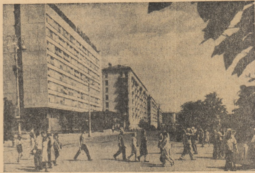
U.R.S.S.: Vedere de pe strada Frunze din Moscova

Raportul Comisiei economice pentru Africa a fost prezentat de Robert Gardiner, care a subliniat că Comisia a intrat într-o nouă etapă a activității ei în vederea dezvoltării economice a acestei regiuni. În prezent — a arătat el — s-a depășit faza cercetărilor generale și s-a trecut la trecea a executării proiectelor.