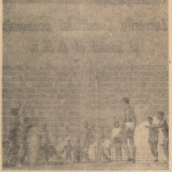
Zile de tîrbîră la Costinești