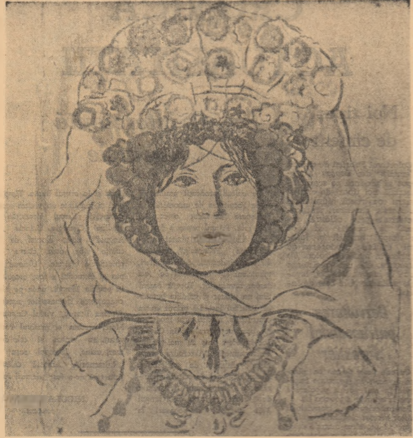
Mireasă din Avrig

O dată era s-o păim. Descoperise, în focul luptelor, pe coama unui deal, cișca mestecului fier și singular. Voise să se ridice în picioare și să vadă mai bine clătănarea încetă a mestecului. Dar, în aceeași clipă, din direcția aceea s'afirmă gloanțele inamicului. După întimplarea asta mi-a mărturisit: „Cind s-o termina războiul — că s-o termina odată, nu-i așa, Ioane? — o să iau obiceiul să cutreier țara în lung și în lat”. „O să mă luati și pe mine?” — l-am întrebat eu. „Păi cum să nu te iau, Ioane, nu ești tu agentul meu de legătură?” Izbușise în ris. Și cu un înțeles că așa va fi. Avea un ris de om bun. Îmi mai spunea: „Tu, Ioane, o să vezi... o să treacă anii și amintirile o să ne cheame din nou pe me-leagurile ardelenne... O să privesc Carpații, Mureșul, și o să spunem copiilor noștri: