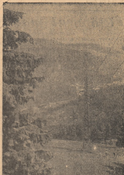
SINAIA: Pelsaj de vară