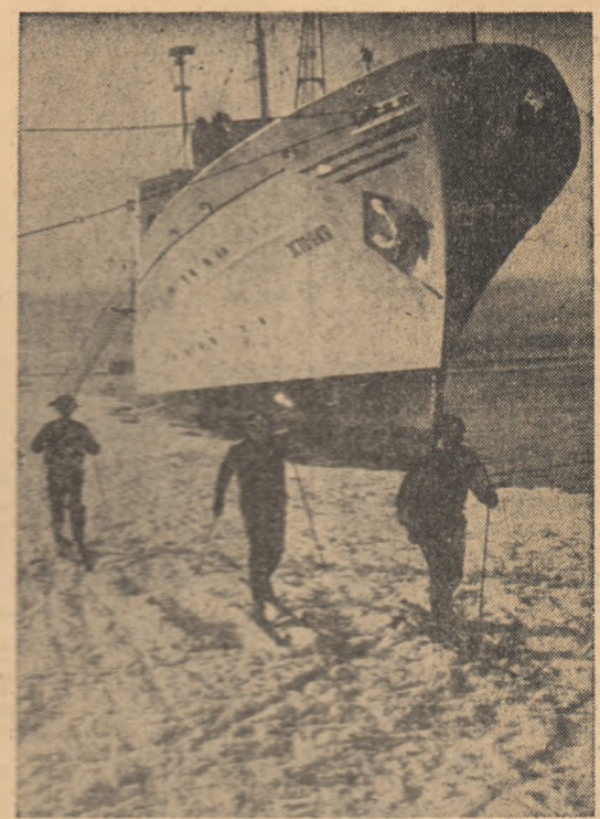
Flotărirea materialului pe schiuri în Antarctica

Cuvîntul de încheiere a fost rostit de Rodolfo Maschin, președinte al F.M.T.D., care a făcut apel la organizațiile membre să depună în comun eforturi sporite pentru îndepărtarea activităților ce stau în fața F.M.T.D.