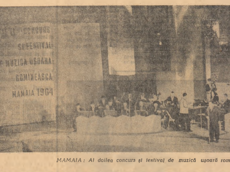
MAMAIA: Al doilea concurs și festival de muzică ușoară românească