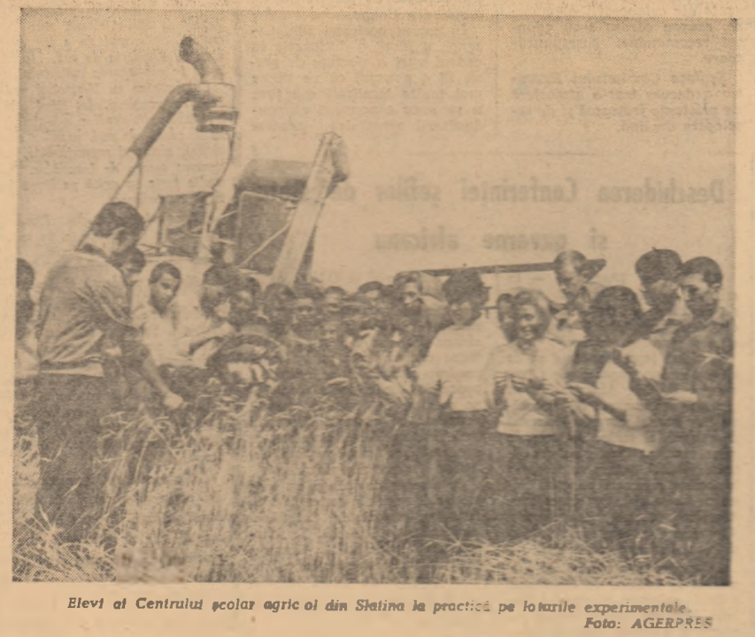
Elevi al Centrului școlar agrar al din Șteina la practică pe loturile experimentale.