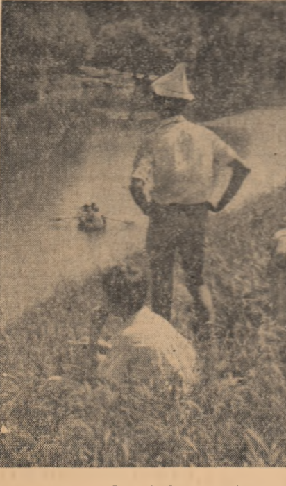
Popas la Crișul Repede