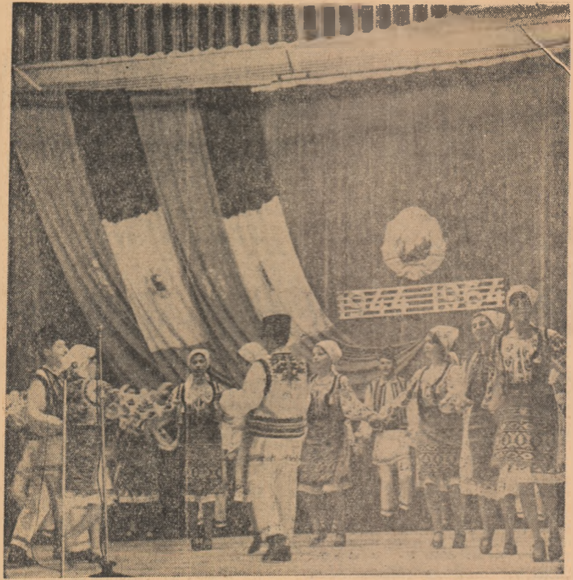
Echipa de dansuri populare a Școlii medii nr. 13 „Mihai Viteazul” din București în timpul concursului.