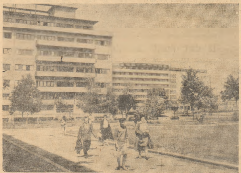
IUGOSLAVIA: Noi construcții de locuințe la Zagreb.

trupelor sale să se retragă pentru a asigura protecția civililor și pentru a ocupa poziții care să le permită să-și țină sub observație pe combatanți. În legătură cu rezoluția adoptată de Parlamentul cipriot în care se cere retragerea trupelor britanice din continentul O.N.U., vicepreședintele Kucuk a dat publicității o declarație în care respinge această hotărâre, declarând că alcătuirea forței internaționale a O.N.U. a fost hotărâtă de către secretarul general, U Thant, după consultări cu guvernul Ciprului, Turciei, Greciei și Angliei. În consecință, hotărârea Parlamentului, a declarat Kucuk, nu ar fi valabilă.