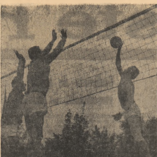
În dispută la fileu, formațiile I.O.R. și Forestierul