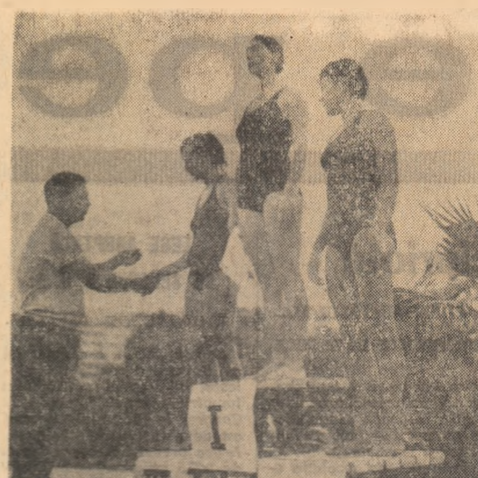
Pe podiumul învingătorilor, primii campioni la natația