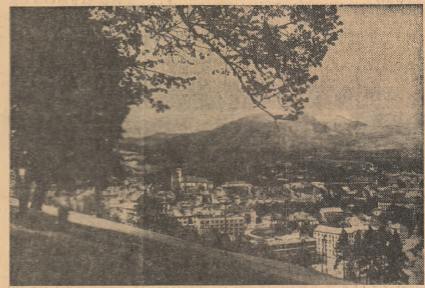
R. S. CEHOSLOVACIA: În fotografie, o vedere panoramică a orașului Banaka Bystrka din Slovacia Centrală

Potrivit noii constituții, judecătorul principal precum și membrii Curții supreme vor fi numiți, respectiv destituiți, de către rege.