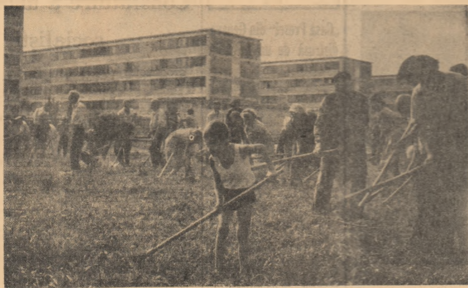
Acțiuni de muncă patriotică în cartierul Giulești

Ieri, de la ora 0 pînă la ora 7 au intrat pe porțile marelui Combinat siderurgic de la Hunedoara 40 de vagoane de metale vechi venite din diferite colțuri ale țării. Tot aici, miercuri, au sosit 160 de vagoane cu metale vechi (ceea ce înseamnă o depășire a cotel zilnice prevăzute).