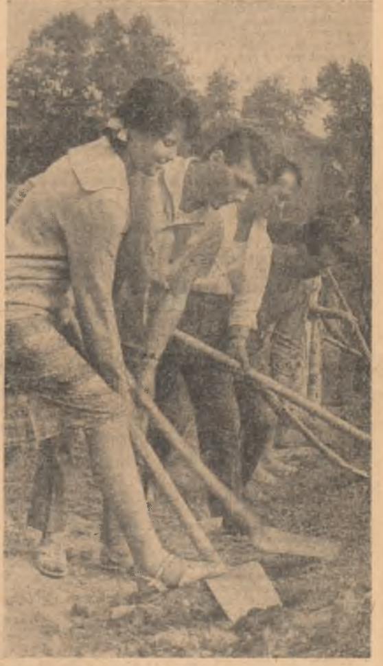
Tineri lucrînd la amenajarea bazei sportive I.M.D.S. din Capitală.

Evenite a tradiție în viața tineretului nostru, acțiunile de muncă patriotică au căpătat o amploare deosebită în împlinirea glorioasei aniversări a Eliberării patriei. Am întîlnit brigăzile uterme de muncă patriotică și la colectarea metalelor vechi pentru cuploarele de la Hunedoara și Reșița, și la redarea de noi terenuri agriculturii. Orașele țării s-au înfrumusețat: i-am întîlnit și aici pe tineri la amenajarea spațiilor verzi, la plantarea pomilor și florilor. Pe pantele inverzite