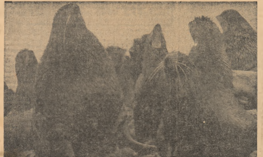
U.R.S.S.: În insulele Komandor vin să se adăpostescă animalele marine. Aceste insule sînt denumite și împărăția păsărilor și animalelor speciale. În fotografie: un grup de morse

Oamenii de știință englezi care cercetează regiunile puțin cunoscute ale Oceanului Indian au stabilit că în regiunea Golfului Aden pămîntul se încălzește de 4-5 ori mai mult ca în alte locuri. Acest fenomen se datorește activității sporite din subsolul regiunii și confirmă încă o dată teza că Africa se îndepărtează de Arabia. Potrivit acestei teze, continentul african se îndepărtează în fiecare an de Peninsula Arabică cu aproximativ un centimetru.