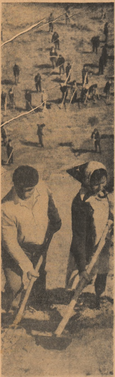
În aceste zile, în întreaga țară tineretul continuă cu entuziasm acțiunile de muncă patriotică. Tinerii pe care-i vedeți în fotografie amenajează noi spații verzi.

Correspondenții noștri din • BAIJA MARE • BACĂU • CLUJ • DEVA • GALAȚI • ORADEA • SUCEAVA • TG. MUREȘ • TIMIȘOARA relatează despre rezultatele obținute de tineret în munca patriotică, despre hotărîrea tinerilor de a întîmpina cu noi succese în această acțiune cea de-a XX-a aniversare a Eliberării patriei