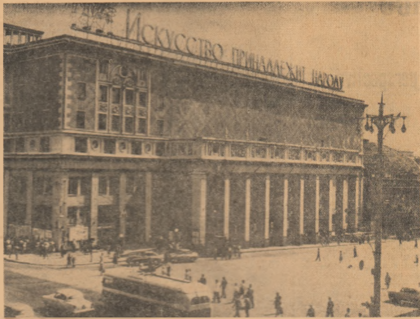
MOSCOVA: Sala de concerte „P. I. Ceaikovski”

În declarație se spune că poporul cuban își exprimă solidaritatea cu poporul R. D. Vietnam.