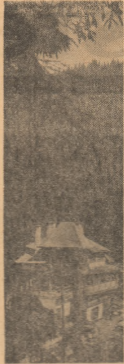
La Locul Roșu

— Ce obiective v-ați propus să mai realizați în continuare? — În primul rând, ne-am gândit să îndreptăm acțiunile tinerilor spre înălțarea unei cit mai mari cantități de furaje. De asemenea, în această perioadă se intensifică munca pentru terminarea obiectivelor sociale culturale: școli, câmine, precum și în agricultură, a grajdurilor, magazinelor, saianelor etc. La realizarea acestora, tinerii vor aduce o contribuție valoroasă.