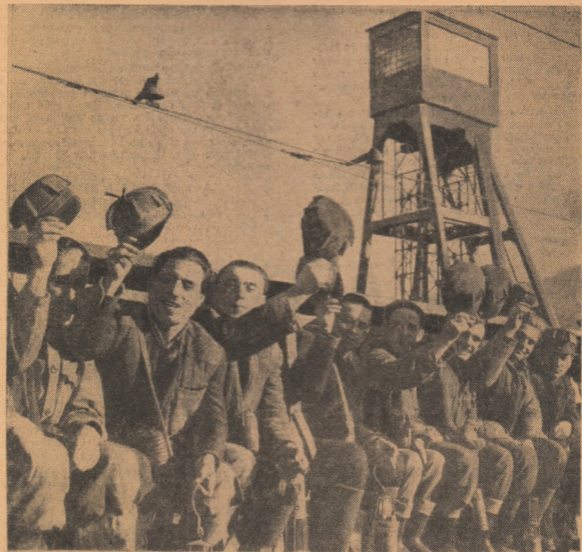
„Noroc bun!” Minerii intrînd în subteran la mina Lupeni

Citiți în pag. a 3-a alte relatări despre participarea tineretului pe șantierele muncii patriotice