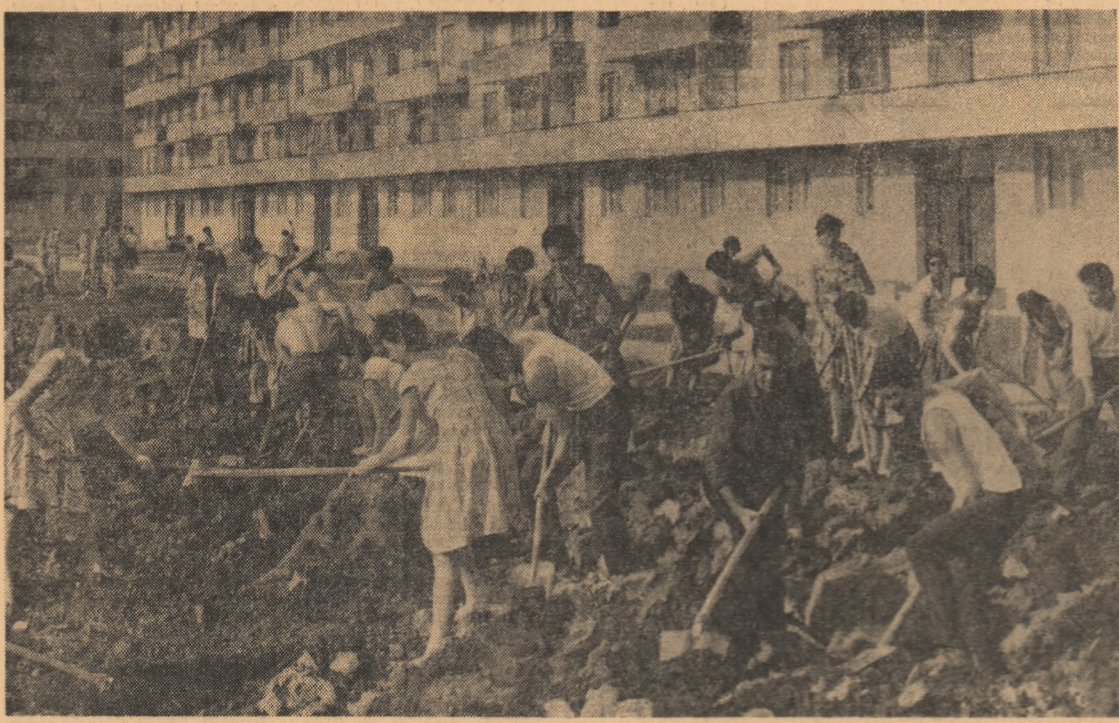
Tineri de la I.P.R.O.M.E.T. din Capitală, amenajează prin muncă patriotică spațiul verde din fața blocurilor din cartierul „Drumul Taberei”.

CORNELIU MĂNESCU ministrul afacerilor externe al Republicii Populare Romine