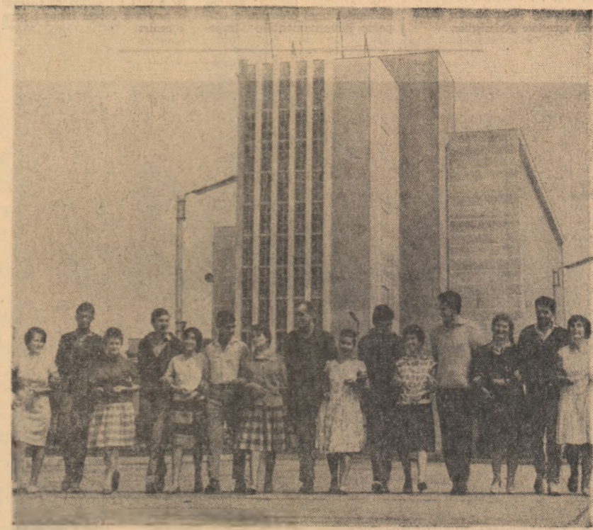
Braț la braț au tinerețea... Sînt numai 15 dintre tinerii de la Fabrica de fire și fibre sintetice Săvinești care, anul acesta, împlinesc vîrsta de 20 de ani.