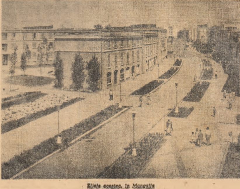
Zărele școlare, în Mangalia