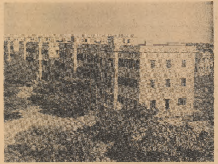
Construcții noi pentru muncitorii Combinatului textil Haru Dinh.

Succesele R. D. Vietnam, apar și mai evidente în contrast cu situația din Vietnamul de sud unde domnește ruina economică și represiunile antipopulare. Într-o Republică Populară Română și Republicii Democratice Vietnam s-au stabilit relații de prietenie și colaborare frățoasă, bazate pe principiile internaționalismului proletar. Relațiile dintre țările noastre servesc intereselor ambelor popoare, cauzelor socialismului și păcii. Poporul nostru sprijină lupta poporului vietnamez pentru renașterea pașnică și democratică a țării sale, se pronunță pentru traducerea în viață a acordurilor de la Geneva cu privire la Vietnam. Ca prilejul celei de-a 19 aniversări a proclamării R. D. Vietnam, poporul nostru, înțina sa generație, urează poporului și tineretului vietnamez noi succese în construcția socialismului, în lupta pentru renașterea pașnică a țării sale, pentru pace.