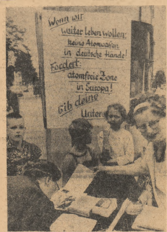
R. F. GERMANĂ. În fotografie, participante ale mișcării pentru pace din orașul Bremen, în timpul campaniei de strângere a semnăturilor pentru realizarea unei zone denucleezate în Europa.

IZMIR 1 (Agerpres). — În urma incidentelor care au avut loc la Târgul internațional din Izmir, 16 din cele 60 de persoane reținute de către poliție au fost arestate. Persoanele arestate urează să compare în fața tribunalului din Izmir la 8 septembrie. În proiectul de rechiziții, procurorul cere pentru acuzații depuse între șase luni și un an închisoare.