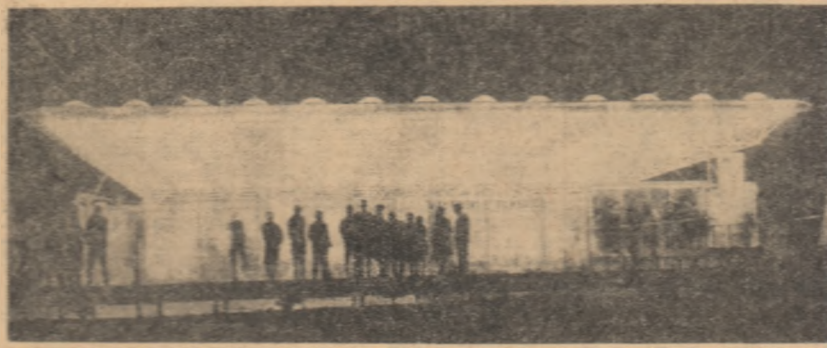
Vedere nocturnă a pavilionului de materiale plastice de la Expoziția realizărilor economice naționale.