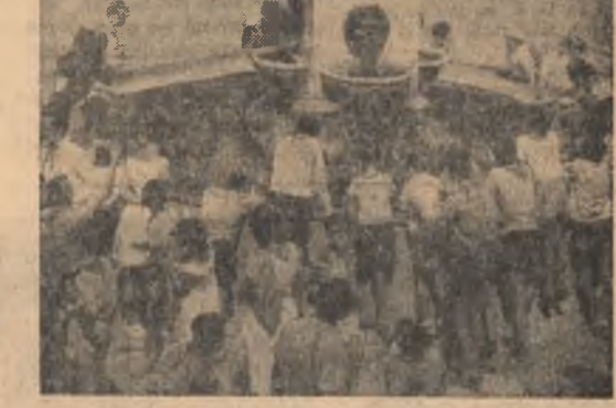
Pionieri în excursie la Herculane.

Celor peste 3 000 de ore de muncă patriotică efectuate anul trecut la asemenea lucrări, li s-au adăugat anul acesta cam zece zile. Așa se face că acum șantierul este în permanență în deplină ordine, mai frumos, iar procesul de producție în asemenea condiții se deslășoară mult mai bine. Dacă pe șantier se cîtează și faptul că la realizarea unei producții ritmice, ordinea și buna gospodărire au fost elemente esențiale, acestea își are izvorul și în munca entuziasată a sotelor de tineri, dornici să termine lucrările de construcție-montaj înainte de termenul stabilit.