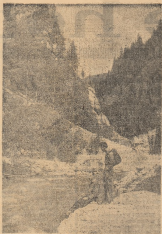
Valea Lotruului Prof. V. ORZA

Intâlnirea dintre echipele orașelor Varșovia și Moscova s-a încheiat cu surprinzătoare victorie a primei formatii la scorul de 3-1 (15-6, 18-13, 14-16, 19-17). În ultimele două partide se întîlnesc București cu Moscova și Varșovia cu Paris.