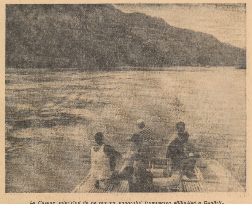
La Cazane, admirînd de pe puntea vaporului frumusețea sîmbății a Dunării.

Și iată-ne la drum către România. De astă dată am devenit gazde. Ne-am bucurat sincer că oaspeții noștri au petrecut împreună cu locuitorii Bucureștilor marea sărbătoare a aniversării Eliberării. În tribunalele din Fieșta Aviatorilor ei au urmărit revărsarea de optimism, de energie și entuziasm a sutelor de mii de bucareșteni. Printre demonstrații au descoperit pe unii din tinerii pe care îi cunoscuserăm o zi înainte la Uzinele „23 August”, eroii ai viitorului nostru reportaje. La Expoziția realizărilor economice naționale au putut să obțină o privire de sinteză asupra succeselor pe care poporul român le-a înregistrat pe drumul desăvîșirii construcției socialismului. Numeroase expozite cu caracteristici tehnice superioare au reținut atenția grupului de ziaristi. O dimineață colegii noștri au petrecut-o la Valea Călugărească unde nu numai că au vizitat un modern combinat viticol, ci au avut și posibilitatea să... guste din producția acestuia, renumită în țară și departe peste granițe. Ultimea seară petrecută în București le-a rezervat satisfacția de a lua parte la magnificul spectacol cultural-sportiv de pe Stadionul „Republicii”. Super-