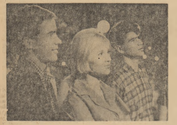
O scenă din filmul „Pășesc prin Moscova”