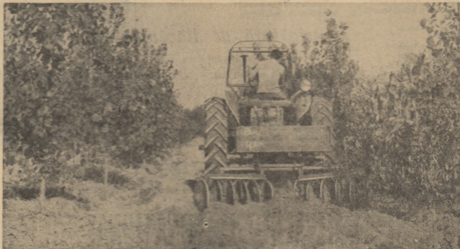
Lucrări de întreținere a plantațiilor de plop Euroamericani, la Ocolul silvic Mitreni, regiunea București.

Tractoarele, semănătorile și celelalte mașini necesare executării lucrărilor agricole au fost revizuite și reparate în proporție de peste 95 la sută. În regiuni se definitivează acum planurile de măsuri pentru efectuarea însămînțărilor și celorlalte lucrări agricole de toamnă în condiții agrotehnice superioare, potrivit recomandărilor Consiliului Superior al Agriculturii și stațiilor agricole experimentale. (Agerpres)