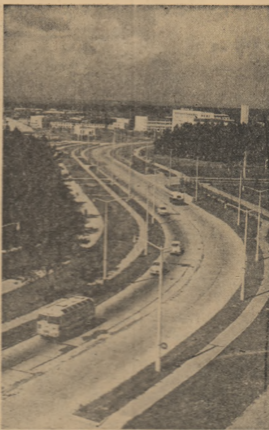
U.R.S.S. În episcopatul unei săli academice construit recent în Imperiul Sovietic.

După ce au mai vorbit delegații Norvegiei, Marocului, Cehoslovaciei, Braziliei și Boliviei, ședința consiliului a fost întreruptă.