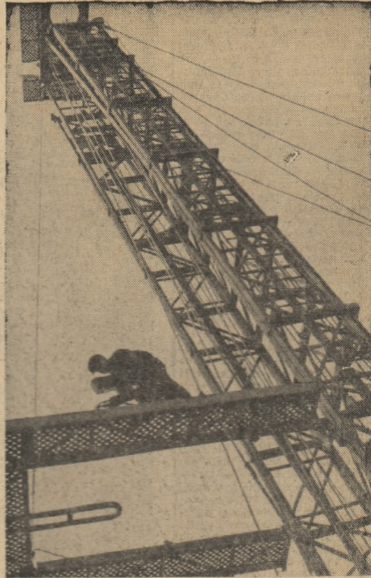
O nouă instalație de foraj la standul de probe al Uzinei „1 Mai”-Ploiești.