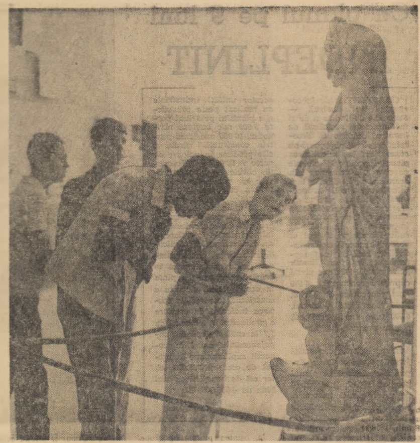
În pavilionul culturii din cadrul Expoziției realizărilor economiei naționale.

tură monumentală ducă imediat la ideea de vastitate, de spațiu întins, (lucru adevărat, în general), trebuie să precizăm că monumentale pot fi opere de mici dimensiuni, pînă și într-o foaie de mîniatură dintre cele admirabile executate de unii mari pictori din secolele al XIV-lea și al XV-lea. Acest lucru nu trebuie să fie uitat, și nici să se creadă că vastitatea unei opere e condiția unică a caracterului ei monumental. — V-am ruga să nominalizăm, se înțelege succint, câteva momente și nume legate de pictura monumentală. — Este normal — date fiind condițiile specifice acestui gen de pictură — să găsim, referindu-ne numai la Europa și de la Bizanț (Incoace) pictură monumentală în palatele și bisericile bizantine; alți la Bizanț cit și la cei care au continuat în această parte a Europei stilul bizantin în arta