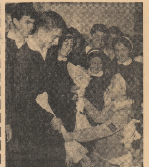
La Școala medie „Aurel Vlaicu” se preia ștafeta...