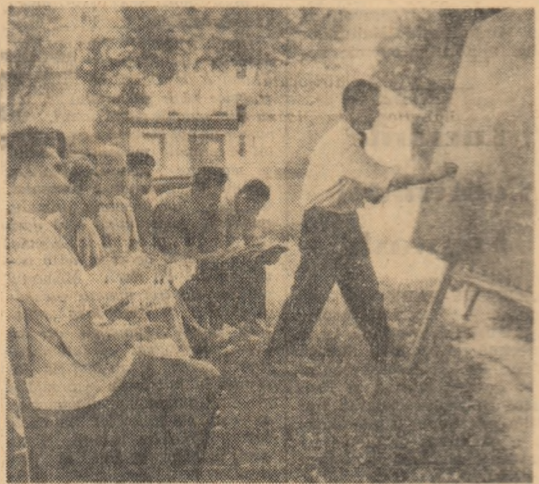
În multe G.A.C. și G.A.S. este o obișnuință ca, periodic, îngrijitorii să decină eleci. În toate regiunile țării se desfășoară în forme diverse un proces continuu de îmbogățire a cunoștințelor profesionale a crescătorilor de animale

S întem la ferma de vaci a gospodăriei de stat Răcăciuni din raionul Bacău. De 10 zile un număr mare de îngrijitorii de animale își perfecționează aici pregătirea profesională la cursurile organizate de Consiliul agricol raional. Noțiunile teoretice însușite de aceștia își găsesc după amiaza continuarea practică în demonstrațiile care au loc la grajduri.