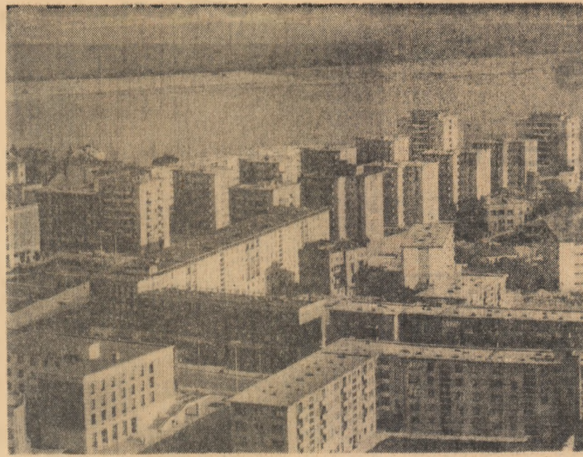
Galati — vedere panoramică a cartierului Țiglina