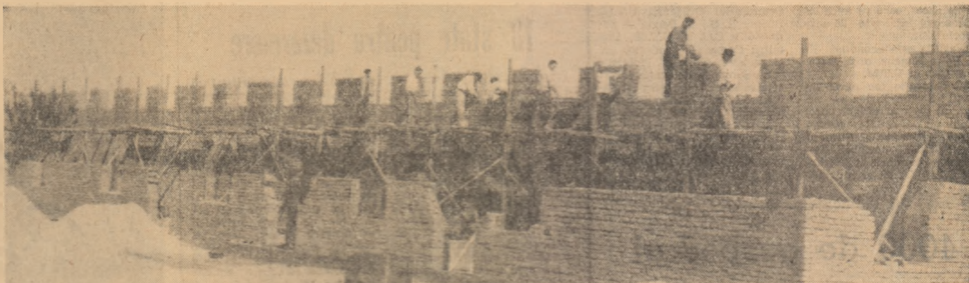
O nouă construcție zootehnică se ridică în curind în imobilul la G.A.C. Jugureni, regiunea Argeș

Organizațiile U.T.M. aduc o contribuție însemnată la înlăturarea acestor obiective, antrenând un număr tot mai mare de tineri pe șantierul construcțiilor zootehnice, la însilozarea tuturor resurselor de furaje, la acțiunile inițiate pentru îmbogățirea cunoștințelor profesionale. În multe unități agricole s-a acumulat o experiență valoroasă în rezolvarea uneia sau alteia din obiectivele amintite mai sus și ca urmare s-au obținut produse ridicate de carne și lapte. În intenția de a contribui la generalizarea acestei experiențe, invităm pe lucrătorii din agricultură: directorii de gospodării de stat, președinții și inginerii din G.A.C., secretarii al organizațiilor U.T.M., bricașerii zootehnici și îngrijitorii frunțași, să împărtășească prin coloanele ziarului nostru metodele proprii folosite în pregătirea iernatului animalelor, prin care și-au propus să asigure și în această perioadă producții constante de lapte și carne. Secvențe din aceste pregătiri le publicăm începând cu această pagină.