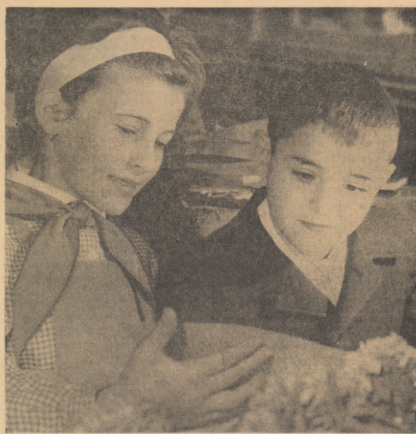
Cunoștință cu manualele

În raionul Sf. Gheorghe, regiunea Brașov, în vreme ce elevii petreceau zile minunate în tabere de munte sau la mare, s-a desfășurat o intensă activitate pentru a le asigura cele mai bune condiții de învățatură.