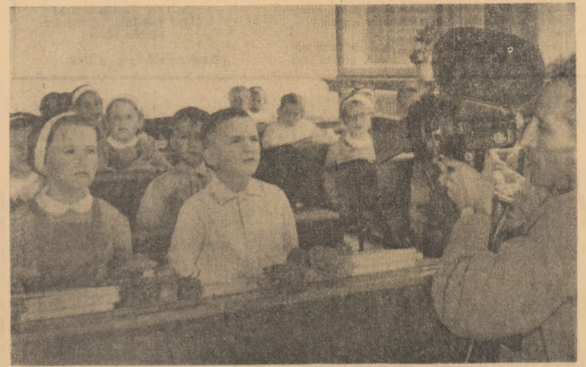
O amintire de... lung metraj

Culegerea cuprinde versuri ale tinerilor poeți ploieșteni, programe și texte literare pentru brigăzile artistice de agitație, poezii din folclorul nou.