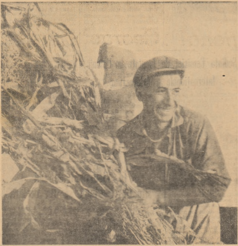
Pregătirea „pășunii de iarnă” a animalelor a început încă din primăvară. În depozitele G.A.S. și G.A.C. se află cantități importante de nutrețuri. Ele sînt completate acum cu noi rezerve. Imaginea alăturată surprinde în timpul însilozării la G.A.C. Ștefan Vodă, regiunea București, o întîlnire în aceste zile în toate unitățile agricole

Există în multe G.A.C. o experiență bună, despre care am amintit, se impune ca aceasta să fie larg răspîndită și folosită. Important este ca acum, în toată culesul porumbului, să se facă repartiția proporțională a forțelor de muncă astfel încît altă zi, cîmp, cit și la construcții lucrările să se desfășoare cu viteza zilnică planificată.