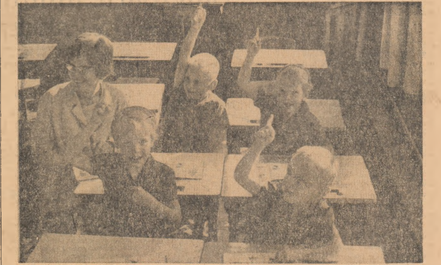
Recent familia Lentenbach din localitatea Deinum (Olanda) a trăit un eveniment însemnat. Cei patru membri ai familiei au început cursurile școlii elementare. Iată-i în fotografie pe gemeni la prima lor vizită la școală.

NEW YORK. — In Comitetul „celor 24” pentru examinarea aplicării Declarației cu privire la acordarea independenței țărilor și popoarelor coloniale a continuat dezbaterile problemei administrării insulelor Falkland (Malvine), asupra cărora Argentina revendică controlul care în prezent îl deține Anglia.