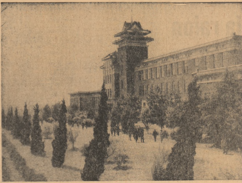
R. P. Chineză. Unul din noile cîmine studențești din Nankin

TOKIO. — Recent a avut loc la Tokio Conferința internațională privind teoria circuitului microundelor și teoria informațiilor, organizată de Institutul japonez de inginerie de electro-comunicații și sub auspiciile Consiliului științific japonez la care au participat reprezentanți din peste 17 țări, printre care și R.P. Romine. Comunicările științifice prezentate de acad. Grigore Moisil și prof. Mihai Drăgănescu au fost primite cu deosebit interes de către participanții la conferință.