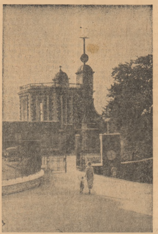
Anglia. Vedere a intrării în parcul istoric Greenwich din apropierea Londrei, cu faimosul Observator Greenwich

WASHINGTON 17 (Agerpres). — Institutul pentru sondarea opiniei publice, Gallup, a anunțat că ultima anchetă întreprinsă în privința rezultatelor viitoarelor alegeri prezidențiale din S.U.A. arată că 65 la sută din alegătorii americani se pronunță în favoarea președintelui Johnson, 29 la sută pentru senatorul Goldwater și 6 la sută s-au arătat nedeciziți. George Gallup, directorul institutului, a declarat că este pentru prima oară în cei 29 de ani de existență ai acestui institut cînd se afirmă o majoritate atât de pronunțată în favoarea unui candidat la președinția S.U.A. Ancheta a arătat, în același timp, că 27 la sută din alegătorii republicani intenționează să voteze pe președintele Johnson, iar 8 la sută din alegătorii democrați. In special din regiunile din sudul S.U.A., se pronunță în favoarea lui Goldwater.