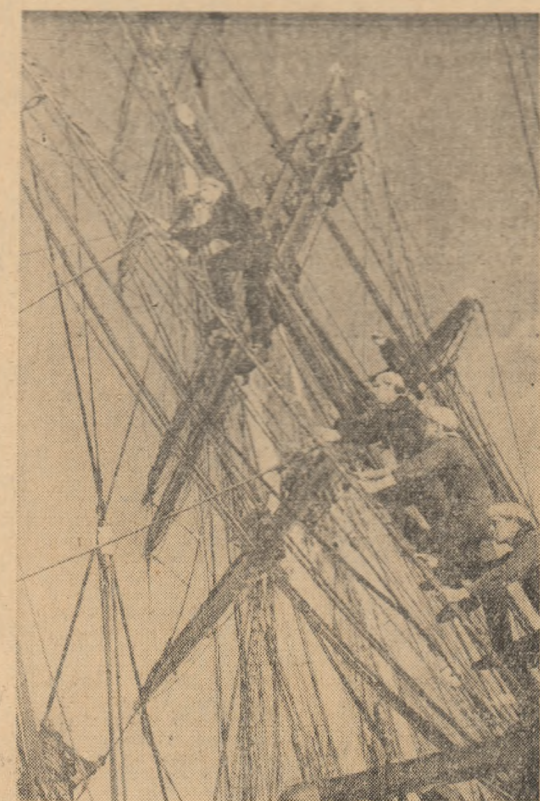
U.R.S.S.: Cursanții școlilor de navigație din Batumi și Heron își fac practica pe nava-scoală „Tovarișci”. În fotografie: Exerciții de ridicare a velelor.

gime de un val de naționalism, care are drept consecință orientarea spre Europa, pentru a căuta o contrapondere la influența americană, a cărei prezență în economie este criticată desigur și care determină țările latino-americane să caute din ce în ce mai des să evite de a se lega prea strîns de Statele Unite.