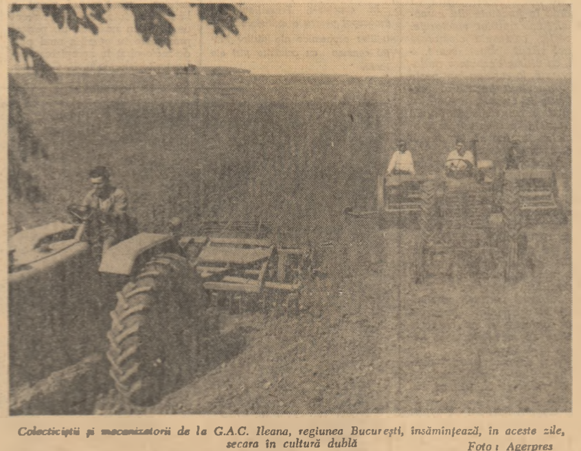
Colecțiștii și mecanizatorii de la G.A.C. Ileana, regiunea București, însămințează, în aceste zile, seara în cultura dublă

Duminică 20 septembrie 1964 8,50: Gimnastica de inviorare; 9,00: Emisiunea pentru copii și tineretul școlar; 10,30: Rețeta gospodinei; 11,00 Emisiunea pentru sate; 19,00: Jurnalul televiziunii; 19,10: Întîmplarea picturii; 19,30: Agenda celui de-al III-lea Concurs Internațional „George Enescu”; 19,45: Aspecte de la înlăturarea de baschet dintre echipele R. P. Romînie și Greciei din cadrul Campionatului balcanic de baschet masculin — Transmisie de la Sala Sporturilor Floreasca: 20,30: Banca de 1 000 000 lire sterline; 22,00: Armonii noi în operă. În încheiere: Buletin de știri. Sport. Buletin meteorologic.