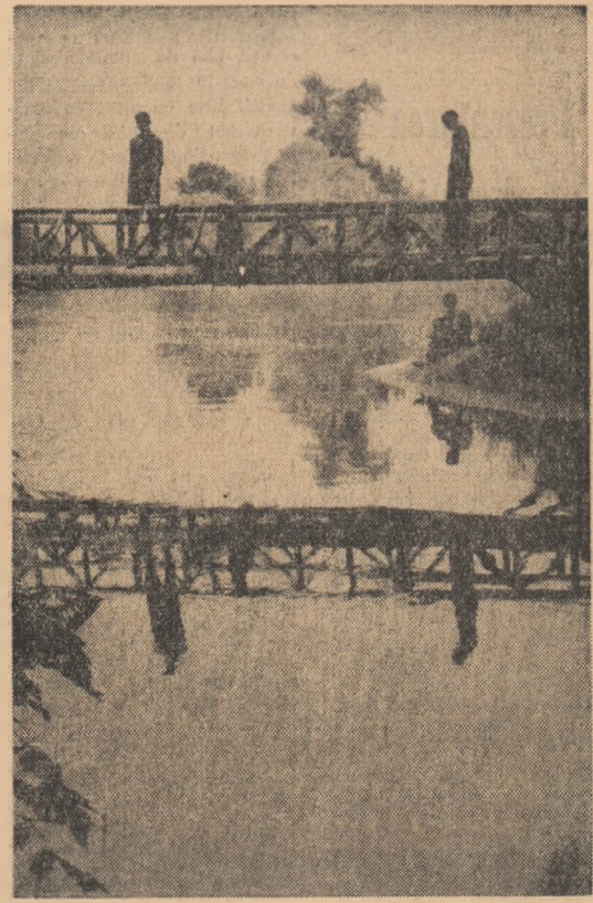
Unde se întîlnește Mureșul cu Stretul

Recent, în secția acoperiri metalice a Laminorului de tablă din Galați a fost realizată și pusă la punct o nouă tehnologie de zincare a tablei pe cale uscată. Spre deosebire de vechiul procedeu, în prezent — înainte de introducerea tablei în baia de zinc — aceasta este uscată și preîncălzită, cu ajutorul unei instalații cu radianți, pînă la o temperatură de 150°C. În acest fel, tabla decapată permite o aderență perfectă între zinc și oțel eliminînd eventualele degradări ce pot surveni la fierberile ulterioare ale produselor. Noul procedeu permite zincarea tablei de 1—3 mm grosime. Primele cantități de tablă zincată prin noul procedeu au și primit calificativul de bună calitate.