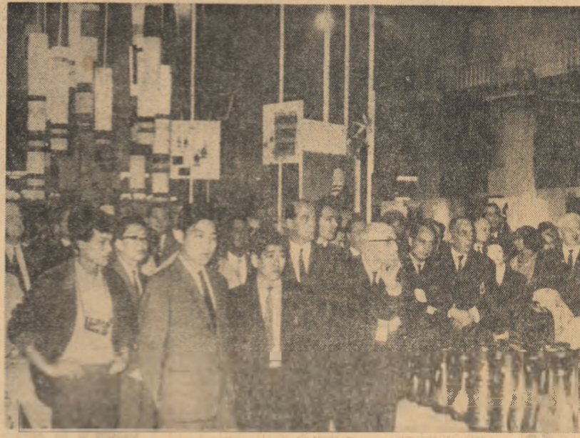
FRANȚA: La marele magazin Luvru din Paris a fost inaugurată de curând expoziția rominească „Bonjour Bucarest“ care timp de câteva săptămâni va prezenta publicului parizian produse ale unor ramuri ale economiei rominești. În fotografie: Un numeros public vizitând expoziția

adresat popoului francez un mesaj de prietenie și de pace din partea popoului român. „Vom avea un excelent prilej de a vă exprima considerația de care poporul nostru o acordă prieteniei tradiționale romino-franceze și dorința sa de a dezvolta și înări această prietenie — a spus președintele M.A.N.“. Voința guvernului și popoarelor noastre de a lărgi și de a adânci bunurile relațiilor dintre România și Franța, posibilitățile reale care există în această privință, au fost subliniate în mod expresiv cu prilejul vizitei în Franța a delegației guvernamentale romine condusă de președintele Consiliului de Miniștri, Ion Gheorghe Maurer. Realitatea vădită ale acestei vizite, privită cu satisfacție în cele două țări ale noastre, demonstrează o dată mai mult că politica de colaborare pacifistă între state, indiferent de orientarea lor socială și politică, corespunde intereselor lor fundamentale și a intereselor securității generale și păcii. Ne exprimăm convingerea și spus în încheiere Ștefan Voitec, că actuala noastră vizită va contribui din plin la dezvoltarea colaborării între parlamentele celor două țări și în înțelegerea și progresul colaborării romino-franceze“.