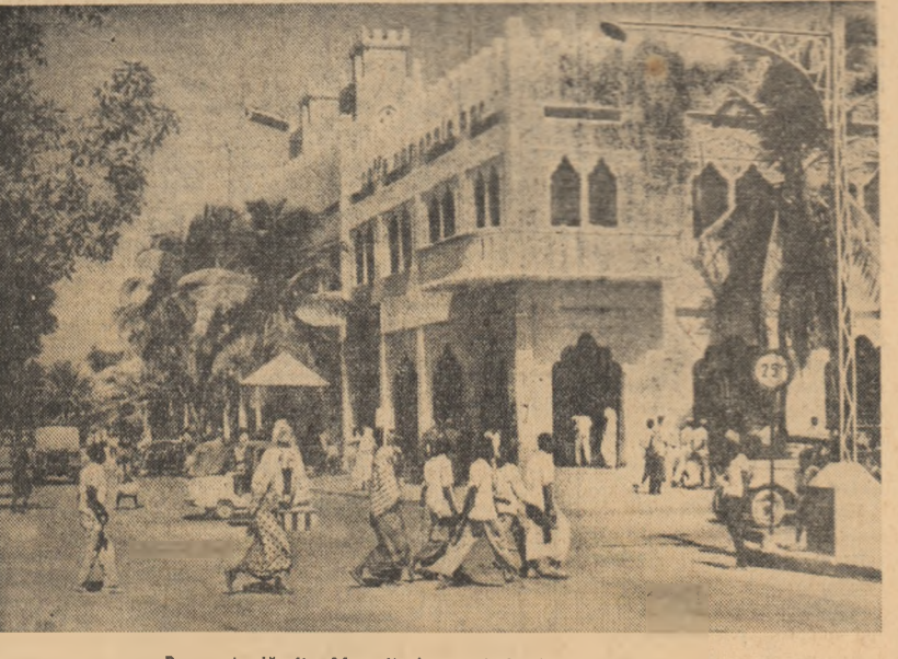
Pe o stradă din Mogadiscio, capitala Republicii Somalia

BAGDAD. — Ziarul „Al Saoura al Arabia“, relatează că printr-un decret al președintelui Arief, au fost demisi din funcție pe care le ocupau o serie de personalități din timpul regimului baasist. Printre aceștia figurează fostul prim-ministru Ahmed Hassan el Bakr care ulterior a deținut funcția de ambasador în Ministerul de Externe fostul general Hardan Taktiri, fostul ambasador în Suedia, fostul ministru al comunicațiilor, Abdel Sattar Abdel Latif, ambasador în Belgia, și fostul director general al căilor ferate din Irak, Diab Akkawi, însărcinat cu afaceri în Afganistan.