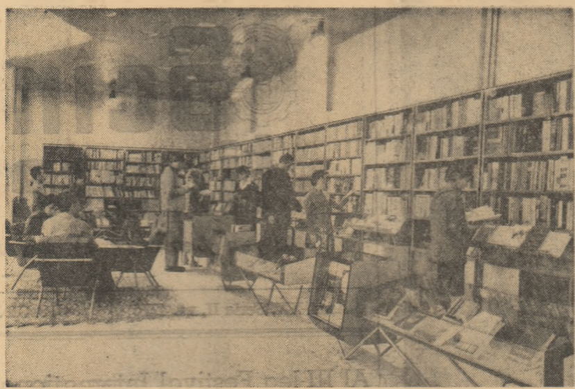
Librăria „Cliprian Porumbescu” din Suceava este vizitată zilnic de șeci și zece de prieteni al cărții