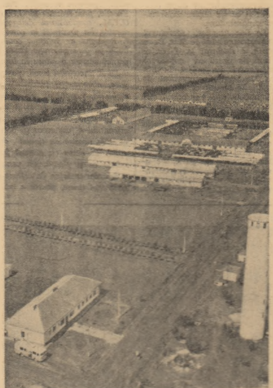
Vedere parțială a sectorului zootehnic al G.A.S. Aradul Nou

Unitățile poștale nu admit în expediere trimiteri adresate instituțiilor, întreprinderilor și organizațiilor, la care denumirea acestora este scrisă prescurtat sau prin inițiale, fără stradă, număr și oficiu poștal de distribuție.