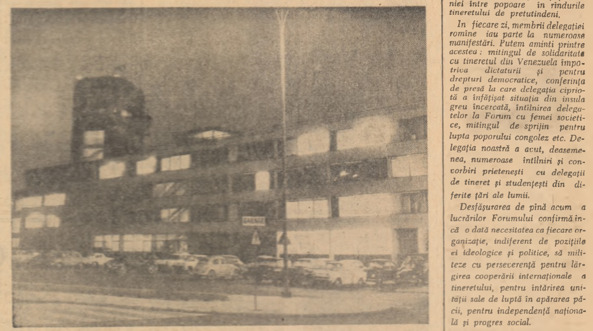
AUSTRIA: Vește noaptea a aeroportului Schwechat din Viena

BERLIN 22 (Agerpres). — Sieral cu corpalul nezaufișit al președintelui Consiliului de Miniștri al R. D. Germane, Otto Grotewohl, a fost săpuit, la sediul C.C. al P.D.A.G. pentru ca populația să-l poată aduce ultimul său omagiu. Funeraliile vor avea loc miercuri 23 septembrie. Consiliul de Stat al R.D.G. a hotărît declararea doliului național timp de trei zile.