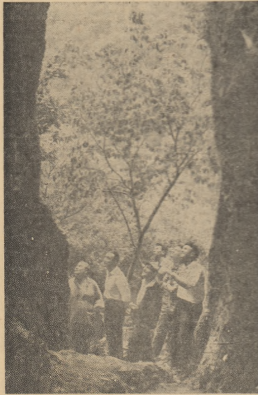
La Grotă cu aburi din apropierea stațiunii Herculană.