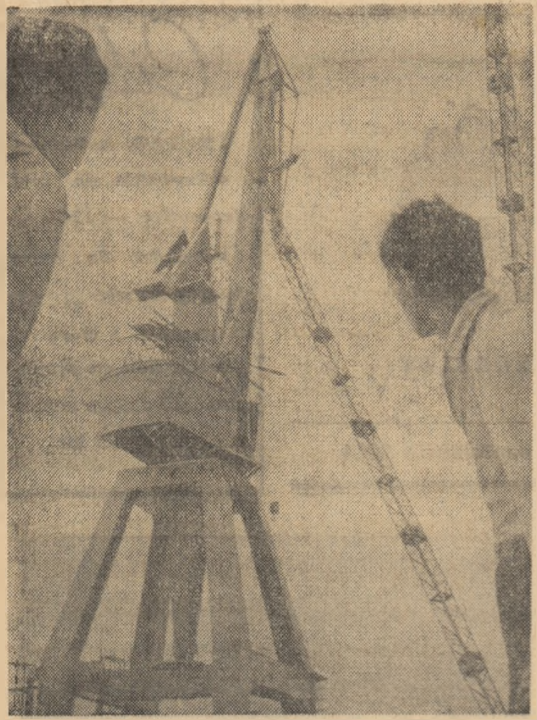
Santierul Naval Galați. Se montează uriașele macarale ce vor servi ca cargourile de zece mii tone.