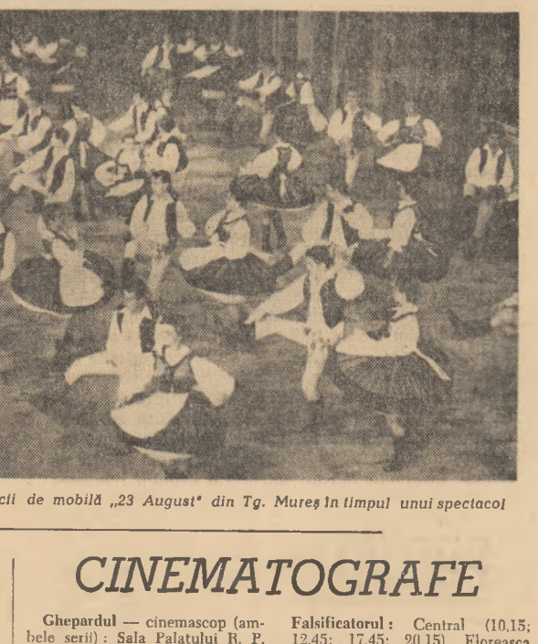
Echipa de dansuri a Fabricii de mobilă „23 August” din Tg. Mureș în timpul unui spectacol.