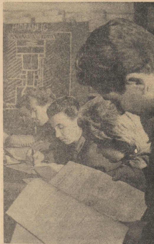
La cabinetul tehnic, după orele de producție