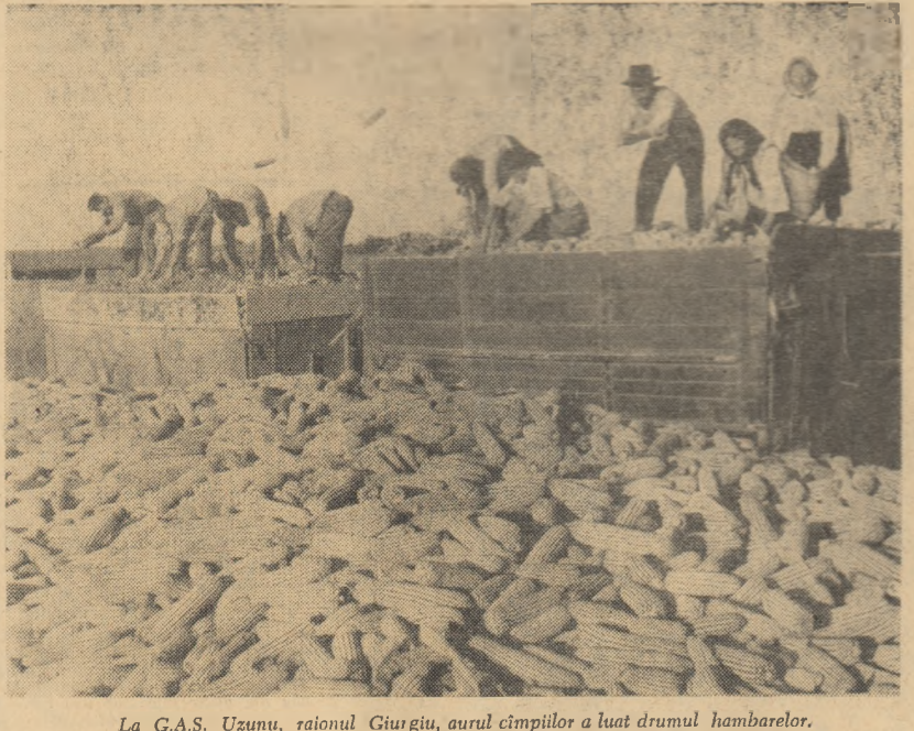
La G.A.S. Uzunu, raionul Giurgiu, aurul cîmpilor a luat drumul hambarelor.