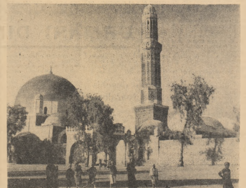
REPUBLICA YEMEN. Moscheea din Sanaa, una din cele mai pitorești clădiri din oraș

Referindu-se la continuarea discuțiilor privind aderarea la C.E.E. țării de democrație progrese în Europa, ziarul „New York Times” scrie: „Ministerul continuă să se opună acțiunii inițiative politice înaintea Angliei și poate să se opună în Pașii comuni. Guvernul de la Bonn și Luxemburg par să fie în favoarea propunerii lui Spaak. Fie că această propunere va fi realizată sau nu un succes, secretele se vor juca într-o măsură care se face în prezent de o înălțată importanță care s-a lăsat în legătură cu viitorul politic al Pașii comuni”.