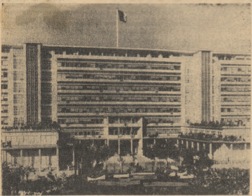
ALGERIA. Vedere asupra „Scurului Africii” din orașul Alger

În primul an de învățămînt, predarea în școli se va face în limba arabă. În încheiere, președintele Ben Bella a subliniat că învățămîntul din școlile algeriene se va baza pe principii naționale, revoluționare și științifice.