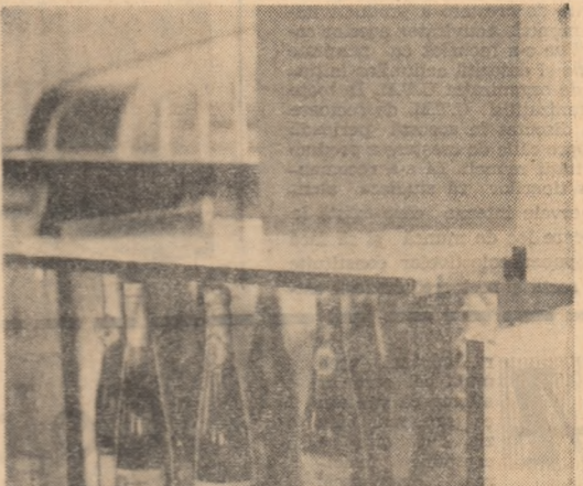
Barul „Artis”, un produs nou executat de I.N.C.F., intru-nec aprecieri unanime. Este foarte simplu și atractiv. Pagina realizată de VICTOR CONSTANTINESCU