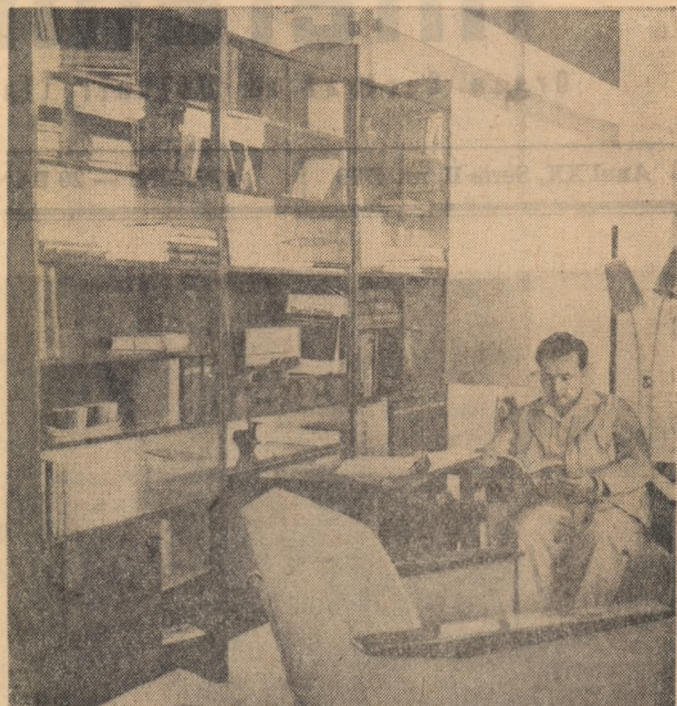
„Milcov 2” — o bibliotecă originală executată de „Tehnolemn”-Timișoara. Are 9 piese detașabile care permit să fie îndalată sau lungită după dimensiunea camerei. Iar dacă cărțile sînt mai mari sau mai mici, rafturile se deplasează și ele în sus sau în jos. Ghidul ne povestește despre bibliotecă că este mult admirată și, după primele cuvinte ale vizitatorilor: „unde este lucrată?”, urmează: „cînd o găsim în comerț!”

Despre părerile unor vizitatori și ale reprezentanților comerțului în legătură cu bunurile de larg consum expuse, și răspunderea lor în comerț, vom reveni într-unul din numeroase viitoare ale ziarului nostru.