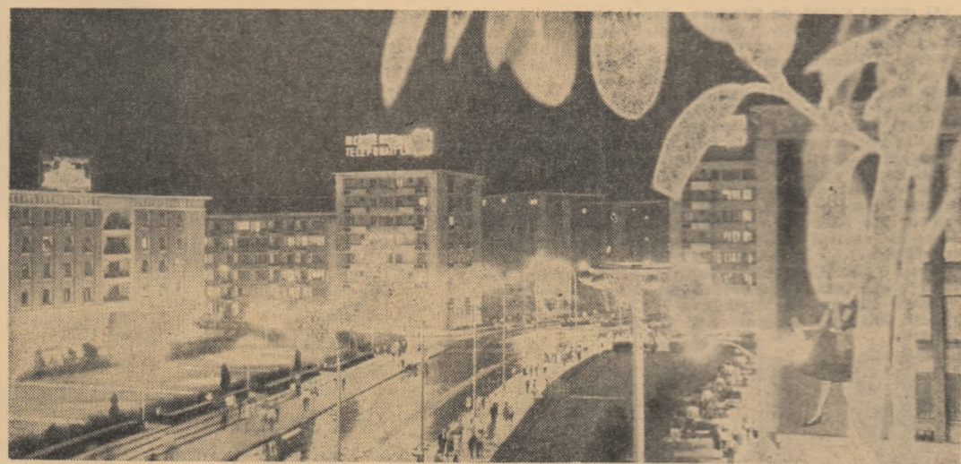
Centrul orașului Galați. Vedere în noaptea

Realizarea unei cit mai înalte productivități a muncii a stat permanent în atenția conducerii uzinei, a sindicatului și a organizației U.T.M. Majoritatea muncitorilor noștri sînt tineri. Măsurile stabilite de conducerea uzinei au fost sprijinite operativ de organizația U.T.M., care s-a preocupat de mobilizarea tuturor tinerilor la îndeplinirea măsurilor tehnico-organizatorice stabilite. Să dăm un exemplu: o dată cu lansarea cifrelor de plan, au fost înființate colective alcătuite din ingineri, tehnicieni și muncitori — care au studiat în fiecare sector posibilitățile de creștere a productivității muncii. Activitatea acestor colective s-a încheiat cu rezultate bune și datorită acțiunilor inițiate de organizația U.T.M. În toate organizațiile U.T.M. de sectoare s-a discutat în această perioadă despre căile de creștere a productivității muncii. Li s-a recomandat tinerilor să studieze atent rezervele interne care există la fiecare loc de muncă și să facă propuneri colectivelor constituite pe secții și sectoare. Au ieșit ast-