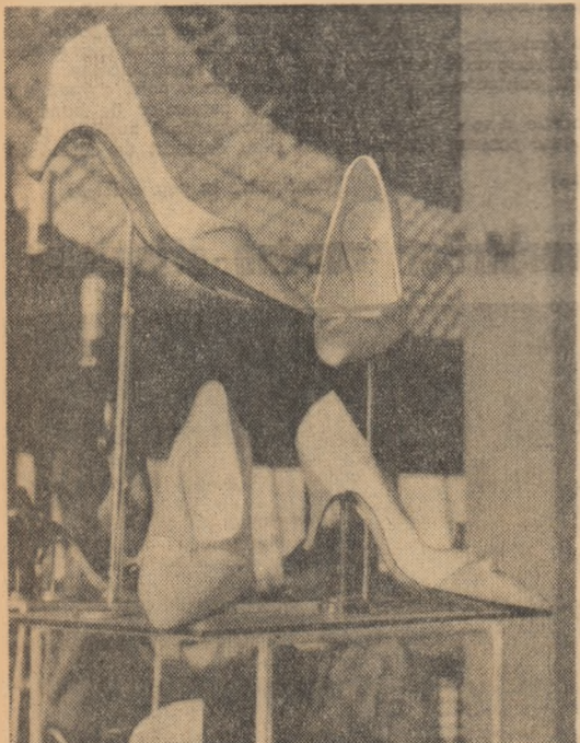
Încălțămintea urmează o linie nouă, elegantă. În același timp tendința este de a se produce tipuri de încălțămintă ușoară, fără întărirea tradiționale (ștali, bombeu etc), în majoritatea cazurilor lipită.