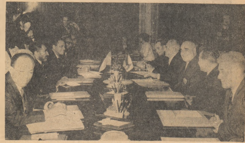
Aspect din timpul convorbirilor romîno-etiope (citiți relatarea în pag. a III-a)