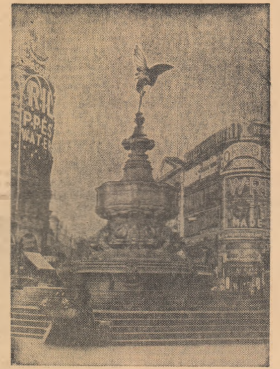
Marca Britanie: Pe una din străzile orașului Londra.