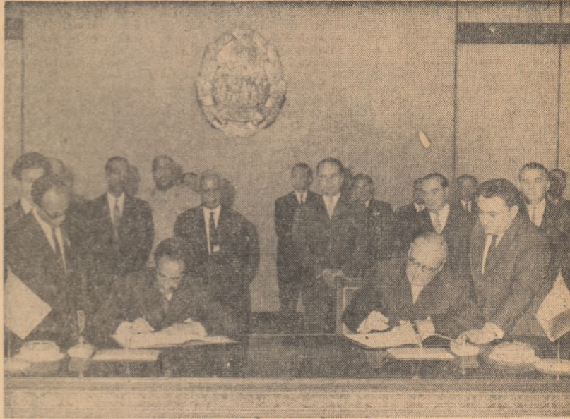
În timpul semnării Comunicatului comun