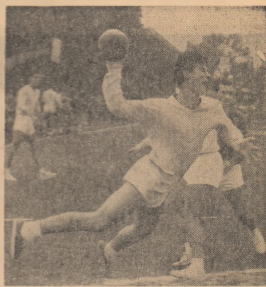
O iază din meciul masculin de handbal Rapid—Știința București, disputat duminică pe stadionul Giulești.