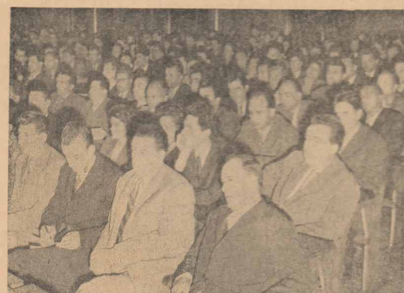
Aspect din timpul adunării solene