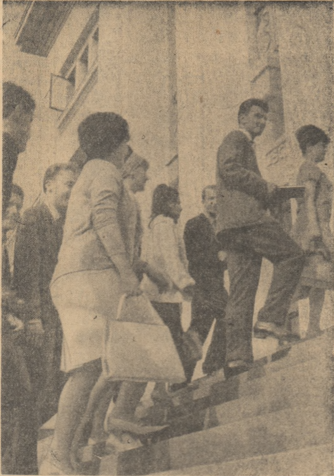
Din nou, la facultate