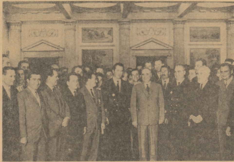
La Consiliul de Stat al R. P. Romîne, după solemnitatea înmînării de ordine și medalii.

Pentru ridicarea calificării profesionale a inginerilor și tehnicienilor, pe lângă cele mai mari unități industriale din regiune au fost organizate 34 cursuri de specializare, care sînt frecventate de mai mult de un sfert din totalul inginerilor existenți în industria regiunii. Sindicatele din întreprinderile acestei regiuni folosesc și alte forme menite să contribuie la îmbogățirea cunoștințelor profesionale ale muncitorilor. În majoritatea întreprinderilor funcționează cursuri de minim tehnic, se țin conferințe tehnice etc. (Agerpres)