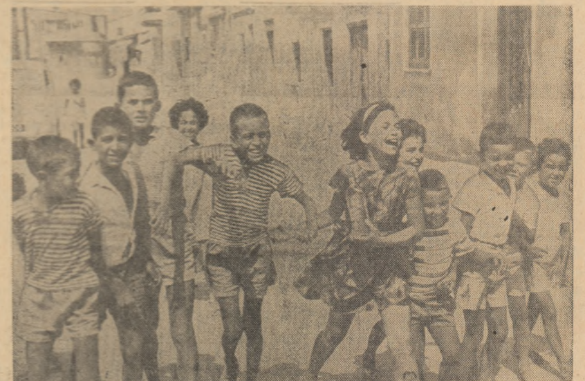
Capul al clipșioșilor grec și turci jucîndu-se împreună

Primul ministru al Nigeriei, Abubakar Tafawa Balewa, care a fost cîndva profesor, a intervenit cerînd greviștilor să-și reia activitatea, dar apelul său nu a fost ascultat. Greva continuă.