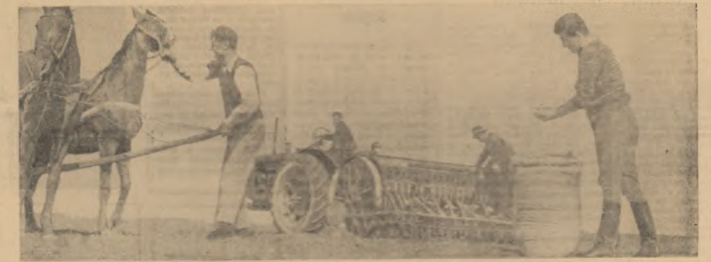
Un scurt popas pentru alimentarea cu sîmînță