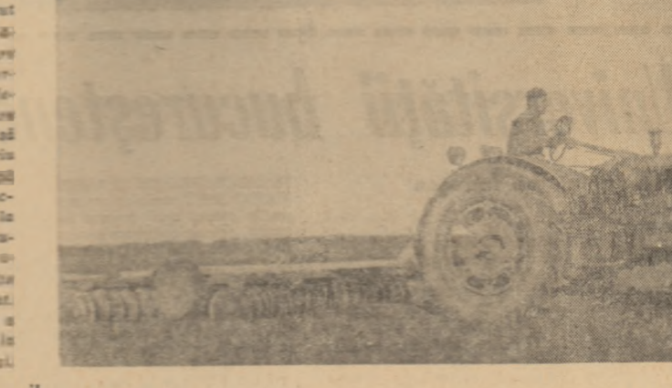
Lucrările repetate cu discul sau grapa asigură un bun pat germinativ

A considerat atunci că este util să facă cu mecanizatorii din brigada sa un scurt colocviu despre calitate. — Ia să-mi spuneți voi... — Urmează o serie de întrebări asupra regulilor ce trebuiau respectate la toate lucrările. Răspunsurile au fost bune. S-a mers din nou la cîmp. A venit și inginerul agronom. S-au făcut sondaje din loc în loc, s-au urmărit cu atenție parcelele, s-au controlat dispozitivele de reglare a agregatului. Fiecare membru al comisiei de recepție și-a notat constatările și la urmă s-au confruntat în colectiv. Concluzia a fost unanimă: „nota 10 la calitate!” Pe toată întinderea de teren lucrată în ziua aceea comisia n-a găsit nici un greș. Și nici a doua zi, nici în zilele următoare.