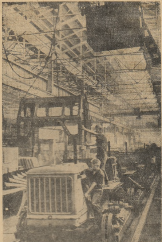
U.R.S.S.: La o secție de asamblare a uzinelor de tractoare din Celiabinsk

Referindu-se la rezultatele alegerilor comunale din Finlanda, agenția Associated Press amintește că majoritatea observatorilor politici din Helsinki au prevăzut o victorie a partidelor de stânga, dar puțini și-au imaginat o înfrângere atât de categorică a partidelor burgheze.