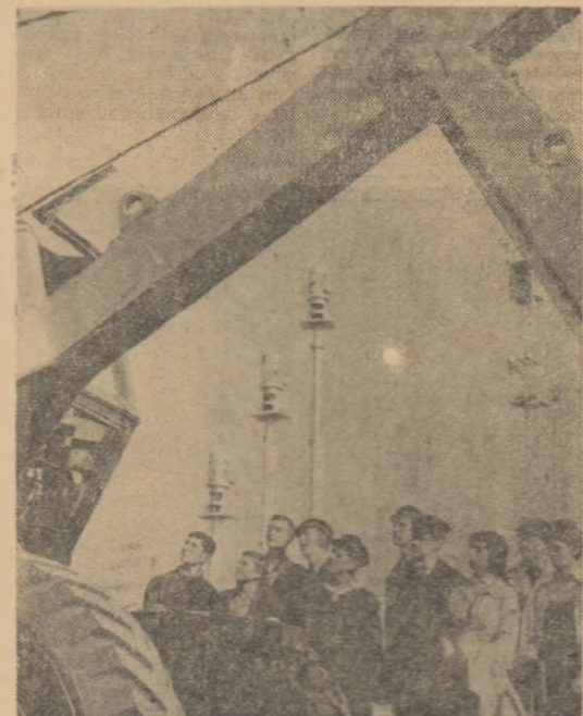
Din Capitală și din multe alte orașe ale țării, mulți elevi vin la Expoziția realizărilor economice naționale pentru a cunoaște înfrumusețile cele noi ale patriei

Înființarea Universității bucureștene a reprezentat un act de însemnată deosebită pentru învățămîntul superior din țara noastră, pentru dezvoltarea științei și culturii românești.