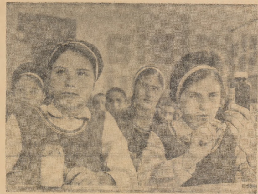
Agricultura este o disciplină îndrăgită de elevii din clasa a VIII-a A a școlii de 8 ani din Mihăilești, regiunea București.