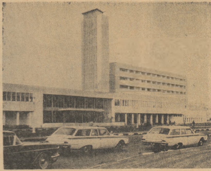
R.A.U. Pe o stradă din Port Said

Ziarele pakistaneze informează pe larg despre sosirea oaspeților români și despre programul vizitelor. Materialele sînt însoțite de fotografii de la sosire.