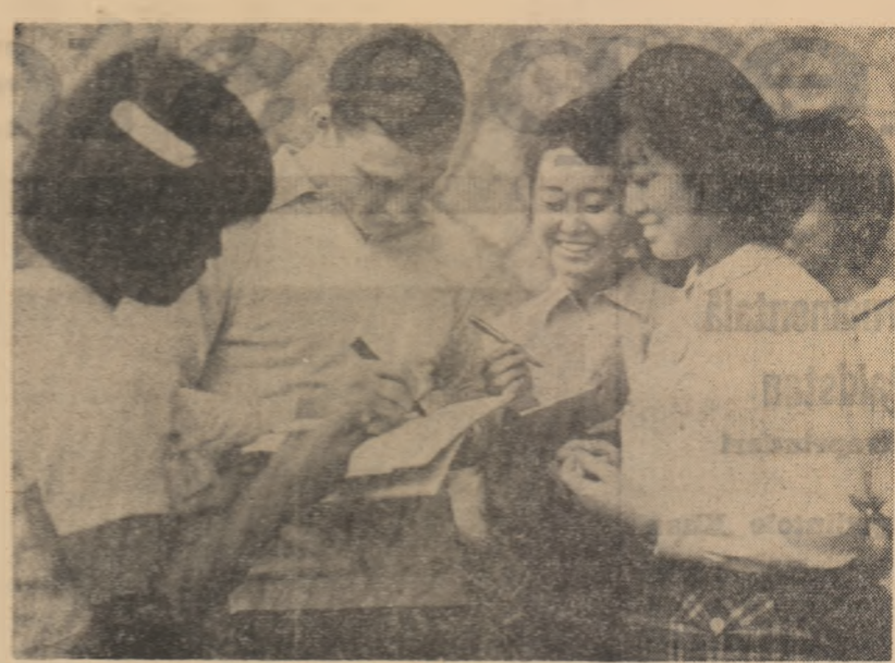
Autografe la satul olimpic