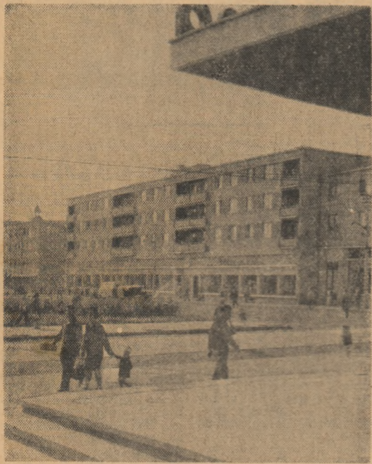
Din noul peisaj al orașului Medgidia.