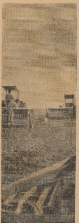
La G.A.S. Malu, raionul Uzi-ceni, mecanizatorii lucrează cu întreaga capacitate a mașinilor la semănat.