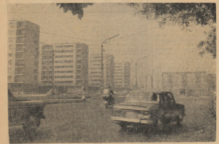
R. P. Ungară. Aspect dintr-un nou cartier al Budapestei

S. PODINĂ corespondentul Agerpres la Moscova