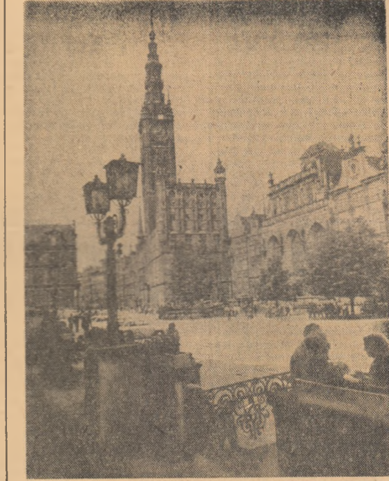
R. P. Polonă: Peisaj varșovian

MILANO 22 (Agerpres). — La Milano au luat sfîrșit cel de-al șaselea Congres și concurs internațional de tehnică cinematografică la care au participat delegații din 21 de țări. Cinematografia rominească a obținut un frumos succes în cadrul concursului, cinci filme prezentate de delegația romină fiind premiate. „Premiul de excelență” (marele premiu) a fost decernat pentru calitatea imaginii realizate de Ovidiu Gologan la filmul „Pădurea spinzuraților” din care au fost prezentate un număr de cadre. „Premiul de onoare” a fost acordat filmelor „Neamul Șoimăreștilor”, „Harap Alb” și „Memoria transăfirului”. Iurul a decernat un premiu special tehnicii cinematografice romine pentru „Procedeu foto optic de titrare a filmelor”.