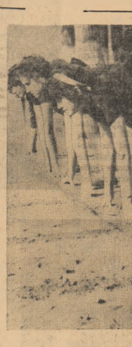
Start în proba de 100 m plat (Aspect de la o „duminică sportivă” disputată recent la Brănești)

Crearea învățămîntului superior artistic este legată de lupta poporului nostru pentru libertate și dreptate socială și a perioadă revoluției de la 1848 și a Unirii. Năzuințele masei populare spre cultură și lumină au fost îmbrățișate în acel timp de un șir întreg de intelectuali, de artiști amatori de ideile progresiste ale