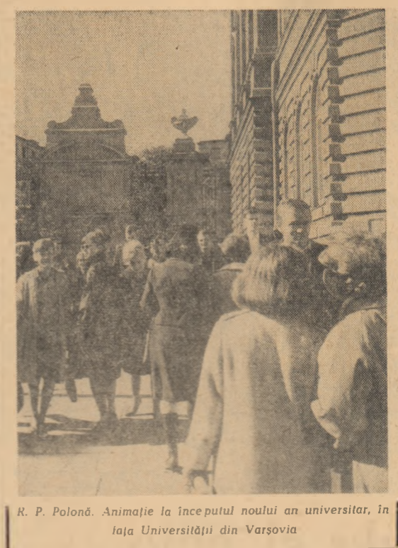
R. P. Polonă. Animație la începutul noului an universitar, în Iași, Universității din Varșovia

Cuvîntarea conducătorului delegației romine a fost înfățișată cu aplauduri de membrii delegațiilor prezente.