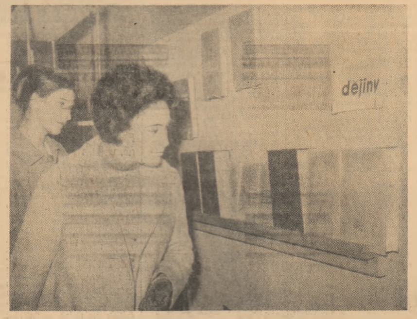
Recent la Praga a avut loc deschiderea Expoziției cărții științifice românești. În fotografie: Un aspect din expoziție

BONN 26 (Agerpres). — În Republica Federală Germană au avut loc duminică alegeri comunale în landurile Hessen, Renania-Palatina și Saar. Politicii datelor proctororii, Partidului social-democrat a obținut în Hessen 54,4 la sută din voturi, ceea ce înseamnă că acest partid a realizat majoritatea absolută, cu un spor de aproape 7 la sută față de 1960. Partidul U.C.D. (Uniunea creștin-democrată) a obținut 27,2 la sută din voturi față de 27,1 la sută în 1960. Ca și în alegerile din Saxonia Inferioară și Renania-Westfală, partidele de dreapta au înregistrat pierderi de voturi de 7,5 la sută în 1960) la 4,8 la sută. În landul Renania-Palatina, Partidul U.C.D. obține 43,7 la sută din voturi față de 43,5 în 1960. Partidul social-democrat a înregistrat și aici un spor important de voturi, obținînd 42,9 la sută din voturi, față de 37,7 la sută în 1960. În landul Saar, potrivit rezultatelor proctororii, Partidul social-democrat a realizat 40,3 la sută din voturi, față de 31,5 în 1960. Partidul U.C.D. a obținut 40,1 la sută față de 38,3 la sută în 1960.