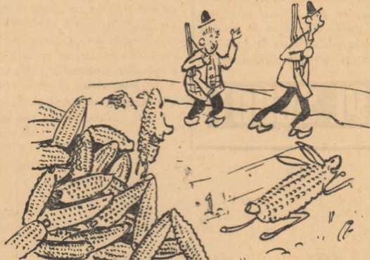
ȘTIULEȚII: — Unde ai pornit să alergi? — Fug și eu, poate mă iau drept iepure și mă adună de pe cîmp...

o pușcă. (S-or fi gândit cei doi Petre — „porumbul o să zboare singur de pe cîmp în păture, iar grîul o să fugă din saci direct în cutiile semănătorilor, și asta-i bine; dar dacă zboară prepelețele și fug iepurii, atunci rămînem cu tolba goală — și înseamnă că am pierdut ziua de pomană”). Am ride noi mai