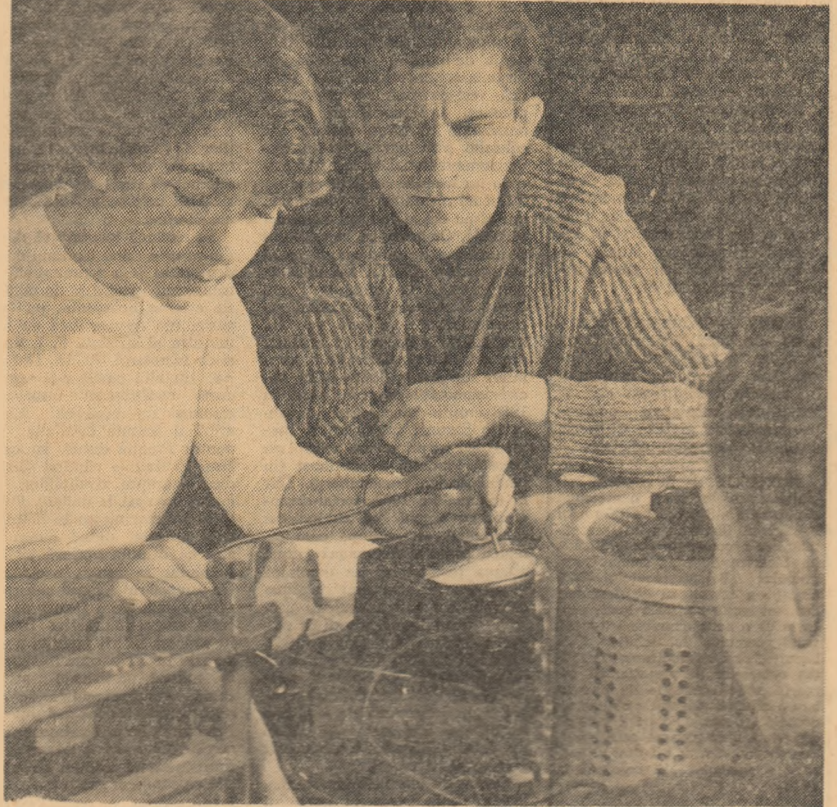
Înjieri în tainele electricității, la laboratorul Facultății de fizică din Cluj