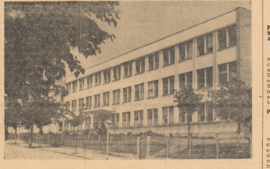
Noua policlinică din Pașcani