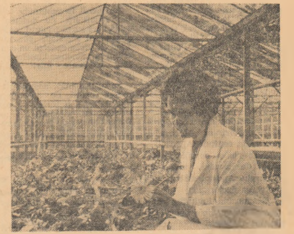
Intr-una din serile Institutului de cercetări hortivilticole din București

Cu prilejul aniversării a 15 ani de la înființarea colectivului redacțional al „Științei tineretului” transmise colectivului Agenției Romine de Presă un călduros salut, urîndu-i noi succese în activitatea sa pentru îndeplinirea sarcinilor de răspundere ce-i stau în față.