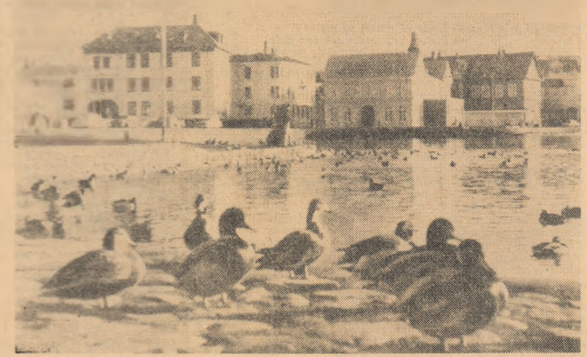
Islanda: Aspect din Reykjavik. Lacul din fotografia noastră nu îngheață niciodată, datorită izvoarelor termale care îl alimentează

Referindu-se la această problemă, ziarul „Neue Zürcher Zeitung” arată că primul ministru Krag a făcut cunoscut că Danemarca pregătește o notă adresată guvernului britanic pentru a explica poziția comercială daneză. Documentul va fi predat de către ministrul de externe Hækkerup, care va pleca la Londra pentru a conferi personal cu colegii săi britanici. Krag nu a făcut nici o mențiune referitoare la conținutul acestei note.