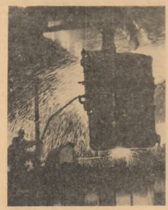
R. P. Chineză: Aspect din secția cuploarelor de tural ojei în lingouri de la otelurile Tientsin

Cel tîrziu pînă în luna martie 1965 urmează să aibă loc alegeri pentru o Adunare Constituantă care să elaboreze o nouă Constituție.