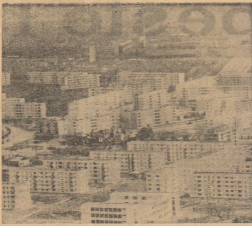
Iași, Cartierul Socola-Nicolina