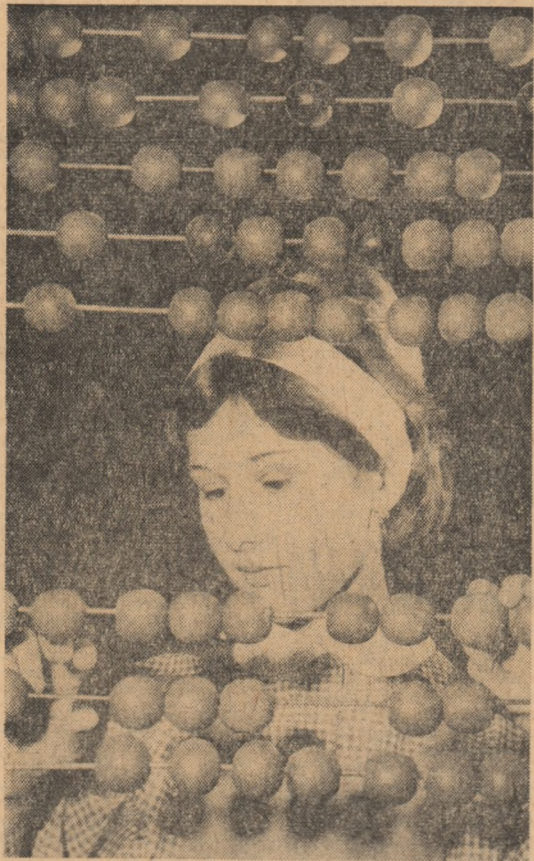
Pînă la rigla de calcul... și bilele pot face minuni!

Pe marile trasee ale întrecerii socialiste