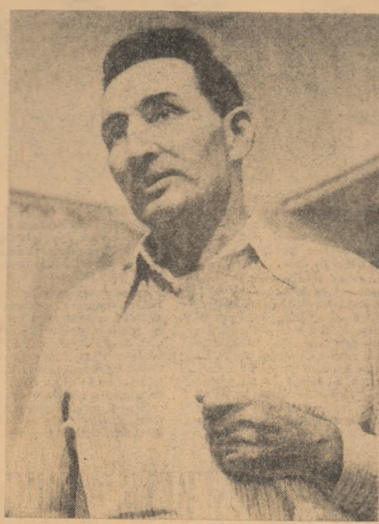
Tatăl lui Rotaru. Este tristost de ceea ce a făcut fiul său. Și cum ar putea să fie? Altele își visează el băiatului...