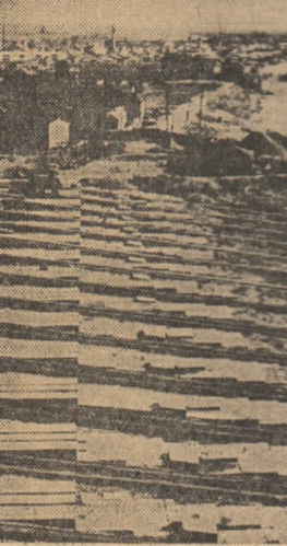
Șantierul naval Galați — un aspect al noii cale de lansare pentru vase