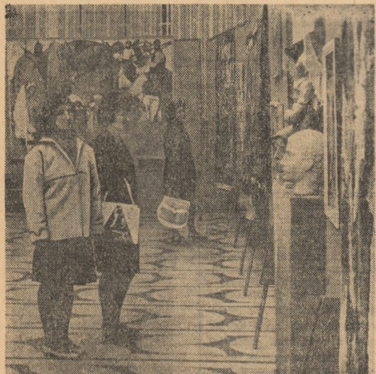
În sălile expoziției prezentate în orașul Iași cuprîndînd lucrări de la cei de-al VI-lea Festival republican al școlilor și Institutelor de artă.