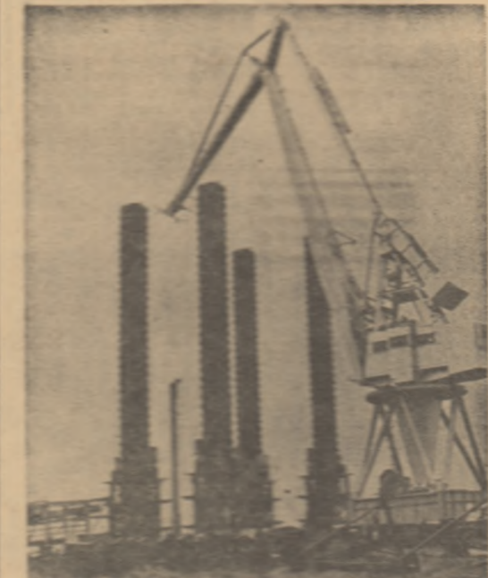
Clonda: În fotografia marșului platforme utilizată la lucrările de extindere a portului Sinesului

Este o nouă zi, în orașul San Salvador, unde se desfășoară lucrările de construcție a unei noi universități. Acesta este primul pas în realizarea proiectului de construire a unei noi universități în Salvador.