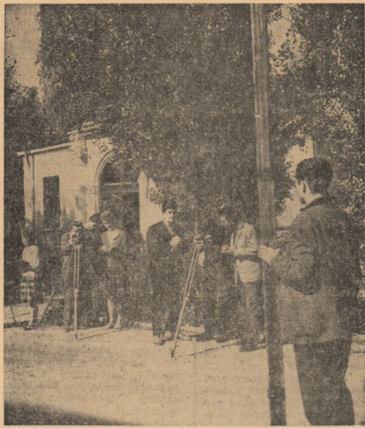
Luciri practice electuate de elevii Centrului școlar geologic din București