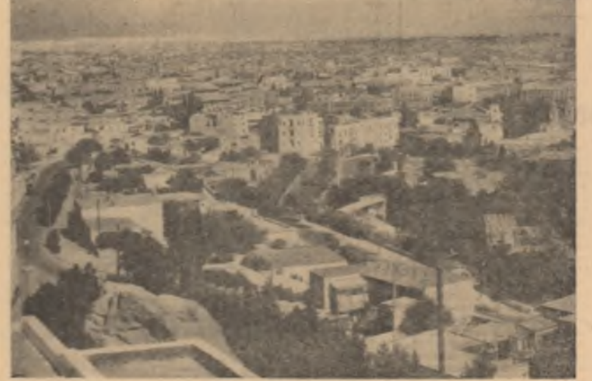
Tețica panoramică al orașului Baku

Baku! Sosim la ora cînd soarele arde ca la tropice. Facem mai întii cunoștință cu istoria veche a orașului, cu monumentele sale arhitecturale și de cultură. Baku este pomoniat pentru prima dată în lucrările geografilor arabi din secolul al X-lea. La începutul secolului al XIX-lea el mai era încă un oraș cîțușie, tipic Evului mediu, cu o populație de numai 5 000 locuitori. Prin marile porți ale zidului cetății de altă dată intrăm în partea veche a orașului. Aici se găsește unul dintre minunatele monumente ale Evului mediu — palatul Shirvanșahilor, construit în secolul al XV-lea. Sculpturi fine în piatră stau măturate depe marea artă a mîstucilor maestri azerbaidjani. Din complexul palatului fac parte și alte monumente arhitecturale ca Mecetea șahului și mausoleul derușului. Potrivit tradiției, mausoleul a fost construit deasupra monumen-