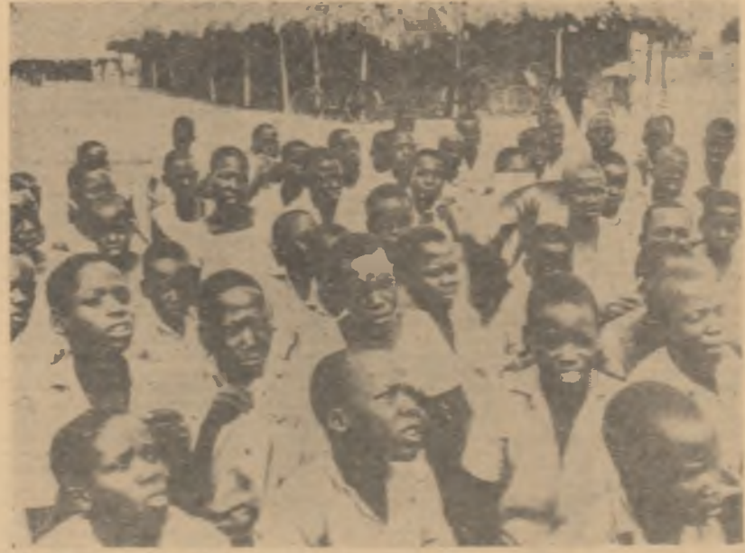
Lectură în aer liber la o grădina din Ughada

La plecarea spre Alger, tovarășul Gheorghe Apostol a mulțumit gazdelor pentru primirea făcută și pentru urările adresate poporului român și a urat locuitorilor departamentului Oasis noi succese în munca pentru prosperitatea Algeriei.