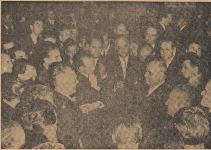
La solemnitatea de la Consiliul de Stat