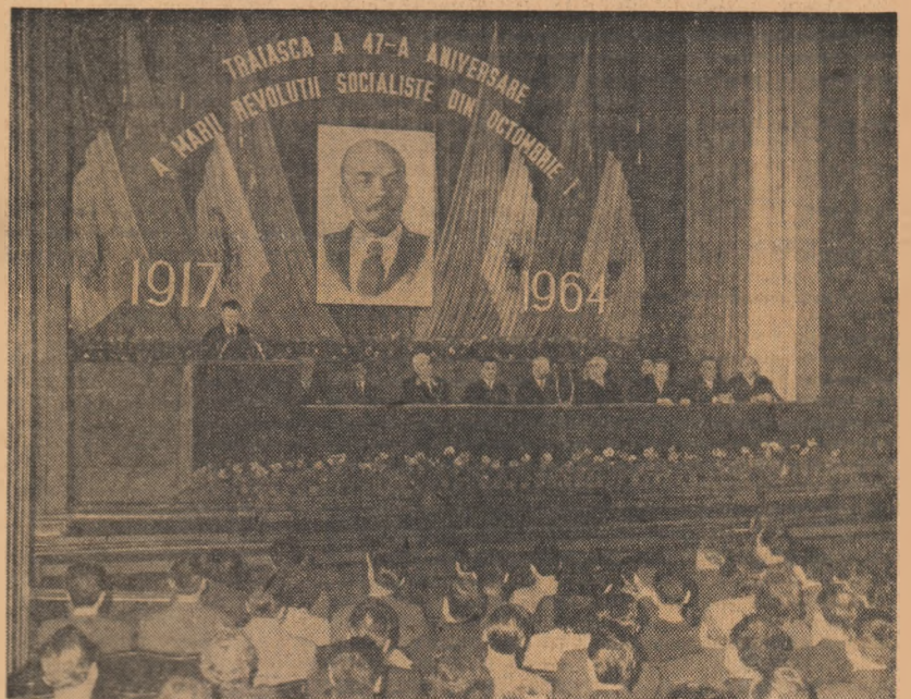
Prezidiul adunării festive

Vineri după-amiază a avut loc, în sala Teatrului Consiliului Central al Sindicatelor din Capitală, adunarea festivă consacrată celei de-a 47-a aniversări a Marii Revoluții Socialiste din Octombrie.