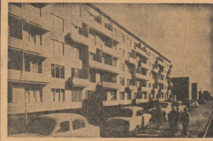
U.R.S.S. Aspect din cartierul Novie Cerimuşki din Moscova

Fie ca prietenia dintre România și Algeria să se întărească și să se dezvolte în interesul popoarelor noastre”.