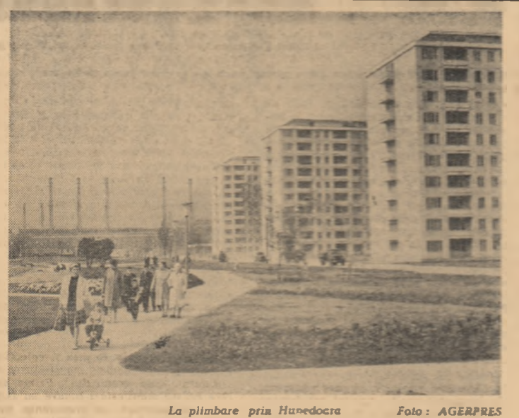
La plimbare prin Hunedoara