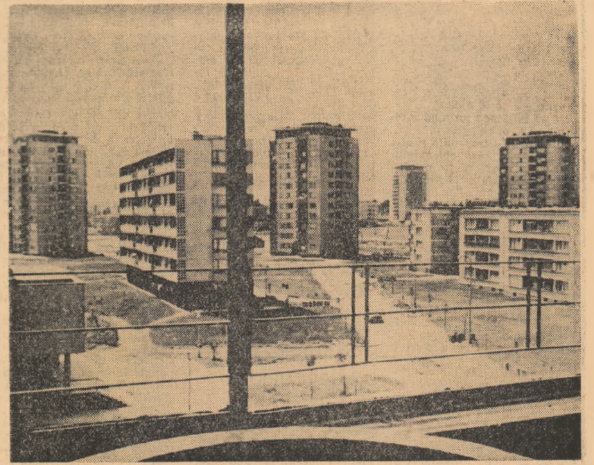
R. P. BULGARIA: Noul complex de locuințe „Hipodruma” din Sofia

Prinzul a decurs într-o atmosferă caldă, prietenească.