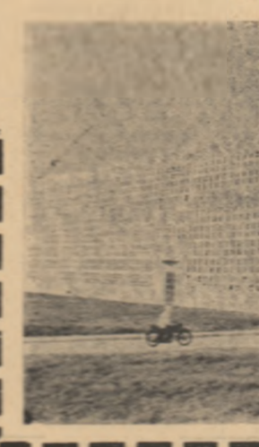
Stația de prefabricate din Craiova

La întreprinderea de prefabricate din Craiova a intrat de curînd în probă tehnologică stația de compresoare, silozul de ciment, depozitul de agregate și centrala de betonare.