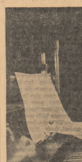
Primele noțiuni de pian

ca secție a Teatrului de Stat din Bacău de proaspătă promovată a Institutului de teatru, în principiu un colectiv care, prin natura împrejurărilor, era oarecum încheiat. Existența unei echipe, formată în majoritate din tineri, a dus în mod firesc la crearea unui teatru a cărui organizare însuși este tinerețe. Nu o tinerețe de circumstanță, ci una de spirit, alți în metodele de punere în scenă a unei piese cit și, suport al acesteia, în formarea celui adevărat entuziasm creator al scenei.