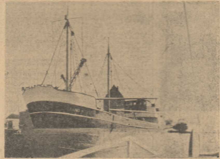
În portul Kolobrzeg din R. P. Polona

Consiliu Național l-a determinat pe Huong să înceapă tratative cu opoziția pentru a renunța echipa guvernamentală. Situația militară din Vietnamul de sud capătă aspect tot mai îngrijorător pentru autoritățile de la Saigon. Agenția U.P.I. anunță că joi seara partizanii sud-vietnamezi au obținut „două victorii majore într-o regiune situată la 75 mile de Saigon” unde zeci de soldați și ofițeri ai armatei guvernamentale au fost uciși.