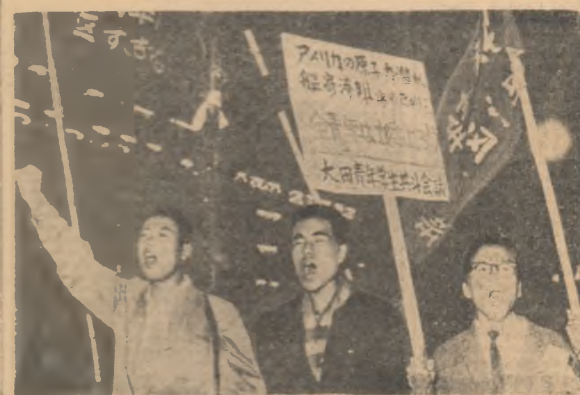
Protestul din Tokyo împotriva staționării submarinelor atomice americane în apele teritoriale japoneze