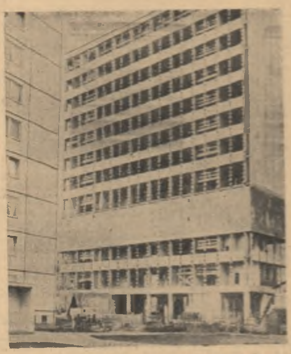
R. D. GERMANĂ. Aspect din centrul orașului Berlin